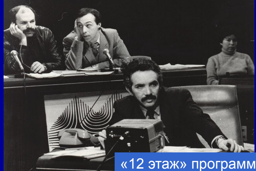
«12 этаж» программа Э. Сагалаева