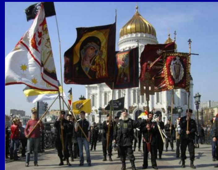
Русское национальное единство