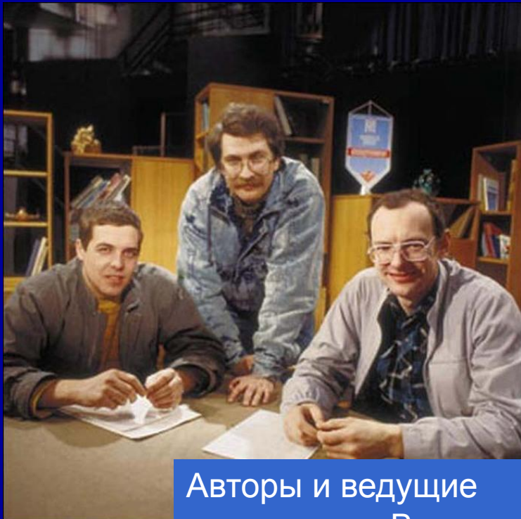
Авторы и ведущие программы «Взгляд»