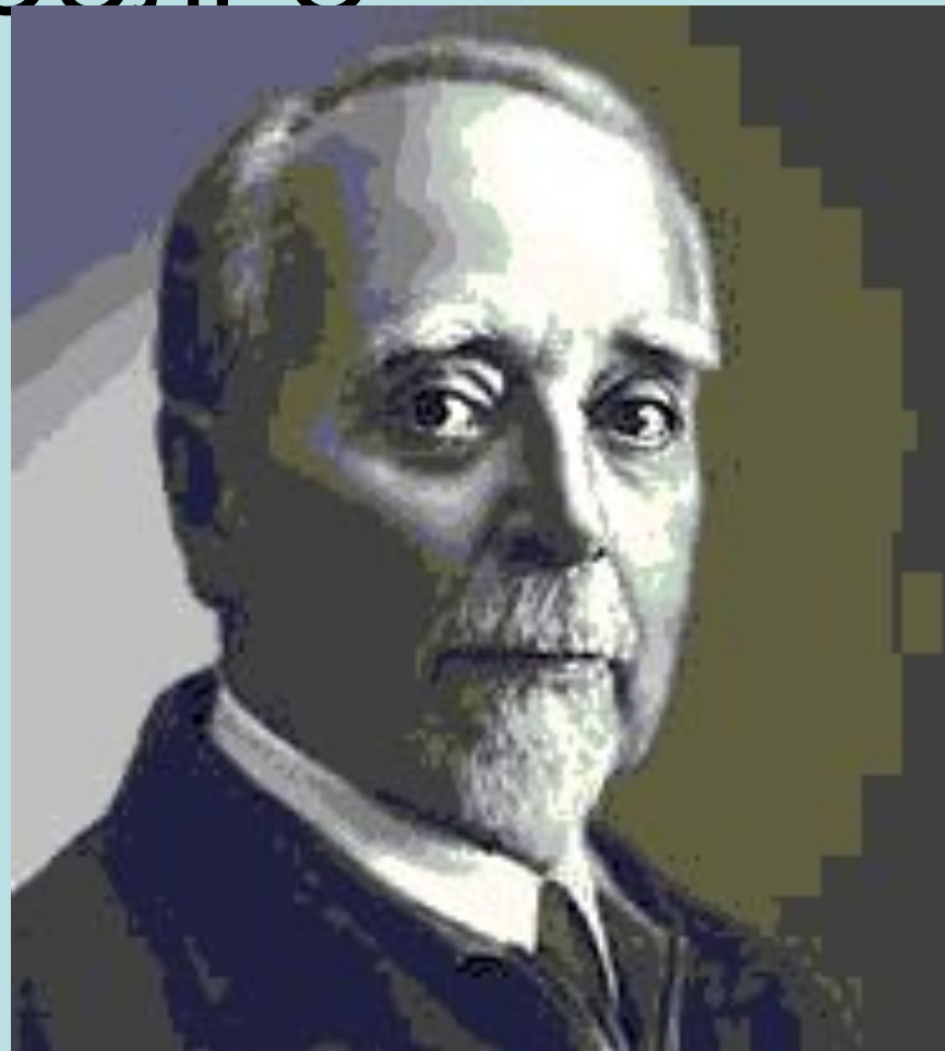
Г. Кржижановский председатель ГОСПлана

План был рассчитан на 10-15 лет и состоял из двух основных программ. Программа А предусматривала восстановление и реконструкцию довоенной электроэнергетики. Программа Б — строительство 30 электростанций (20 тепловых и 10 ГЭС) в основных регионах страны с учетом их природных ресурсов и потребностей развития промышленности