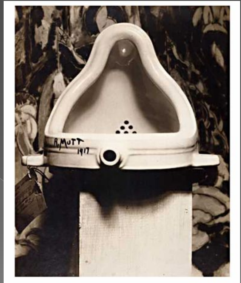
Марсель Дюшан «Фонтан»