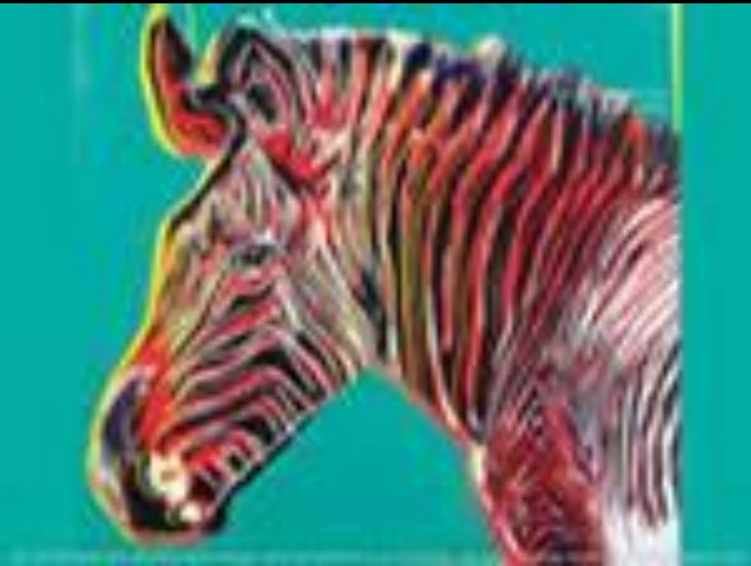
Энди Уорхол «Зебра» 1983г.