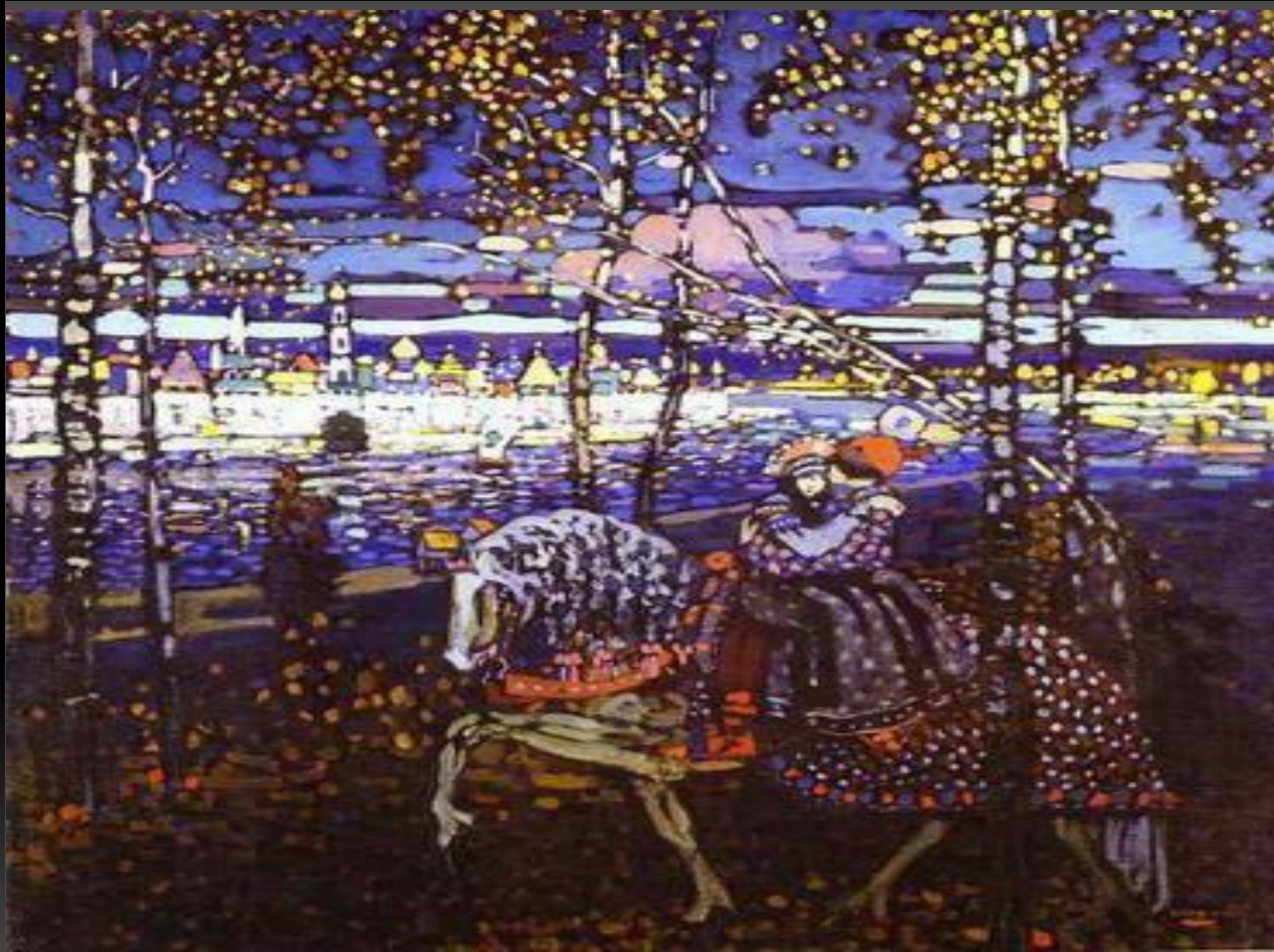
Кандинский Василий «Двое на лошади» 1906 г.