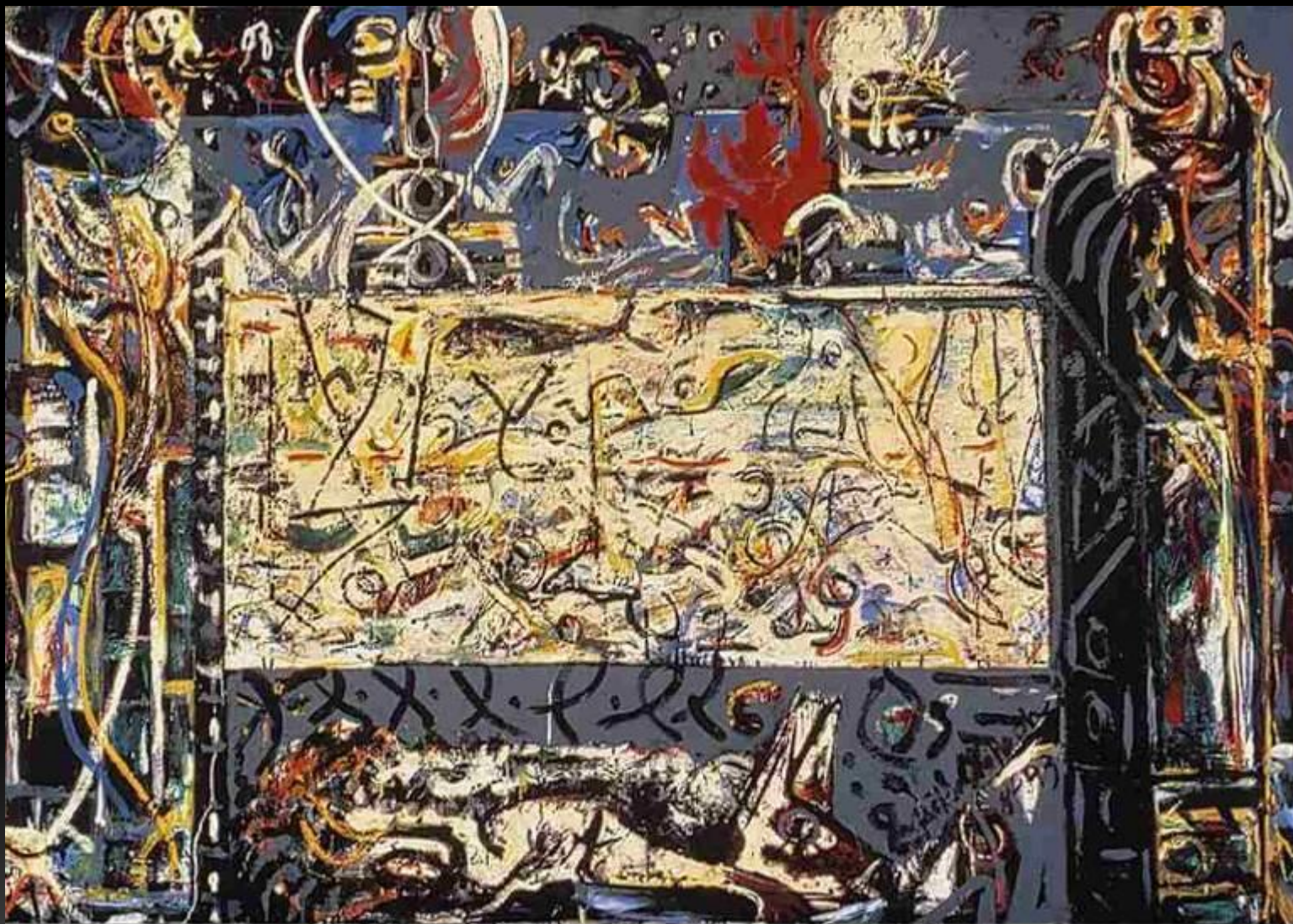
Jackson Pollock - Guardians of the Secret , 1943; 48 3/8 in. x 75 3/8 in.; oil on canvas; Collection SFMOMA; Albert M. Bender Collection, Albert M. Bender Bequest Fund purchase; © Pollock-Krasner Foundation / Artists Rights Society (ARS), New York.