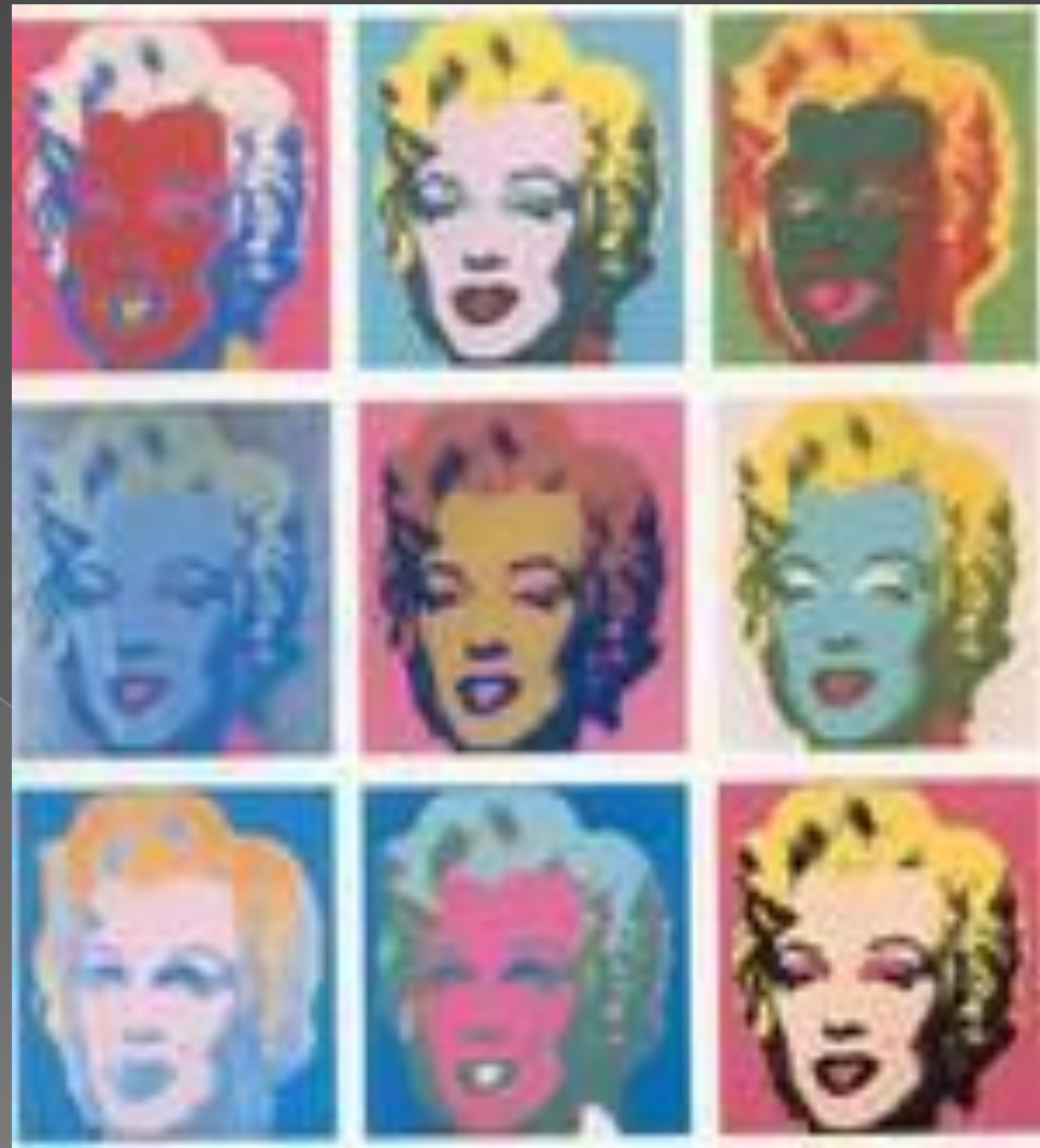
Энди Уорхол «Мэрлин Монро» 1967г.