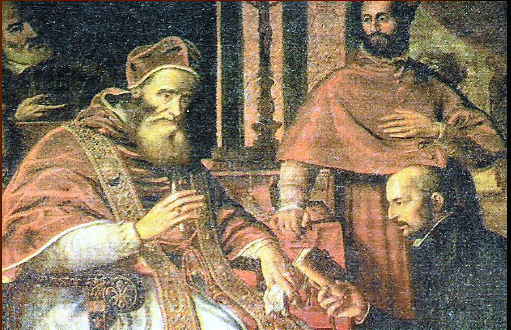
Игнатий Лойола вручает папе Павлу III устав ордена иезуитов.