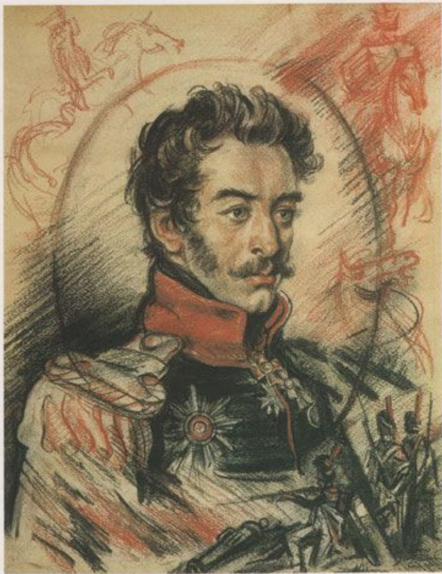
Сергей Григорьевич Волконский 1788—1865