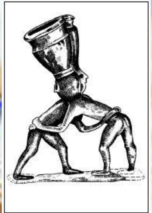
Бронзовая скульптура из Месопотамии, увечковечившая борьбу на поясах (начало III тысячелетия до н.э.)

Этому же району принадлежит самый древний памятник культа борьбы на поясах, в основе которой лежали боевые приемы пленения противника, – бронзовая статуя, изготовленная примерно в 2800 году до н.э. (сейчас она выставлена в Багдадском музее).