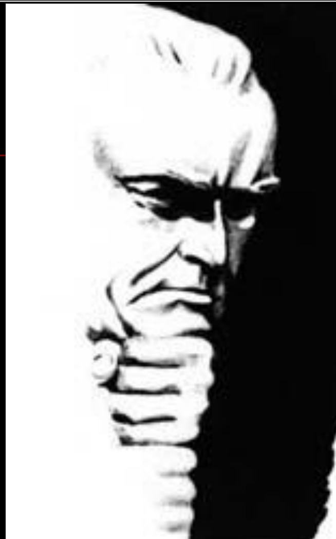
■ Сергей Королев.