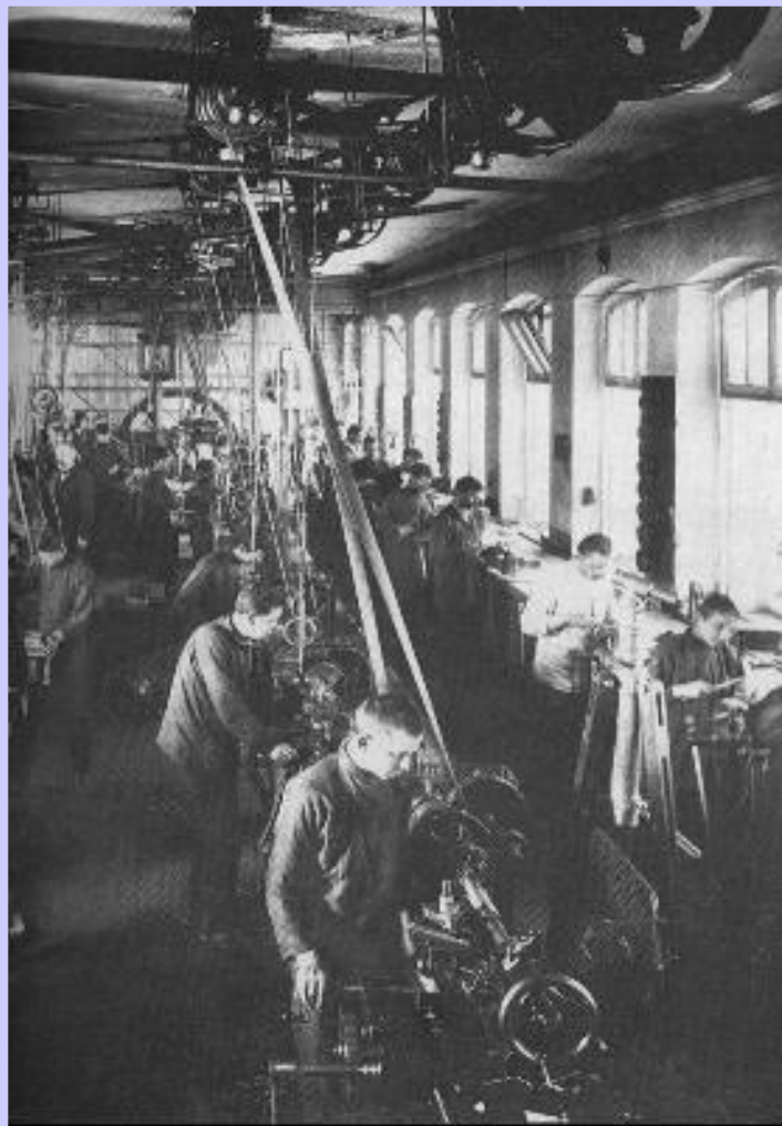
В цехе завода Г.Пека в Петербурге.

Быстрыми темпами развивалась текстильная промышленность. Владельцы мануфактур покупали земли в Ср. Азии и начали выращивать там хлопок. За 30 лет производство текстиля выросло в 30 раз. На Юге успехов достигла свеклосахарная промышленность (рост в 6 раз).