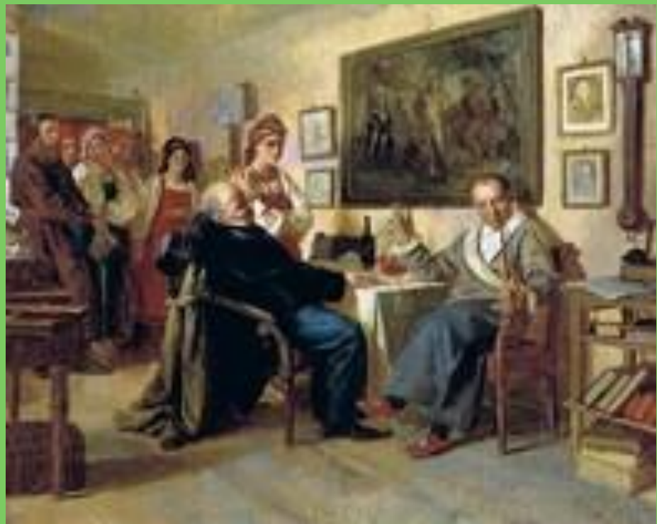
Торг Сцена из крепостного быта (Россия) (Художник Н.В. Неврев)