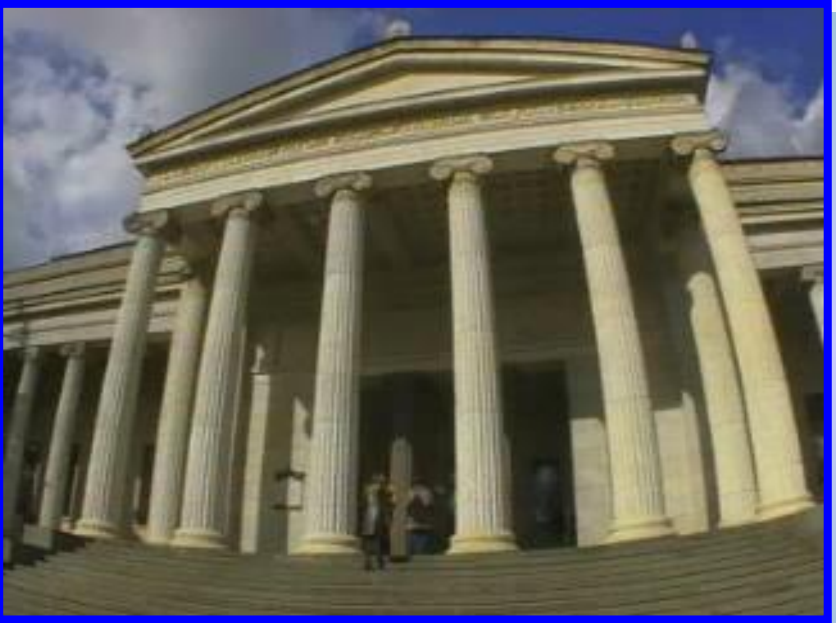
Музей изобразительных искусств имени Пушкина.