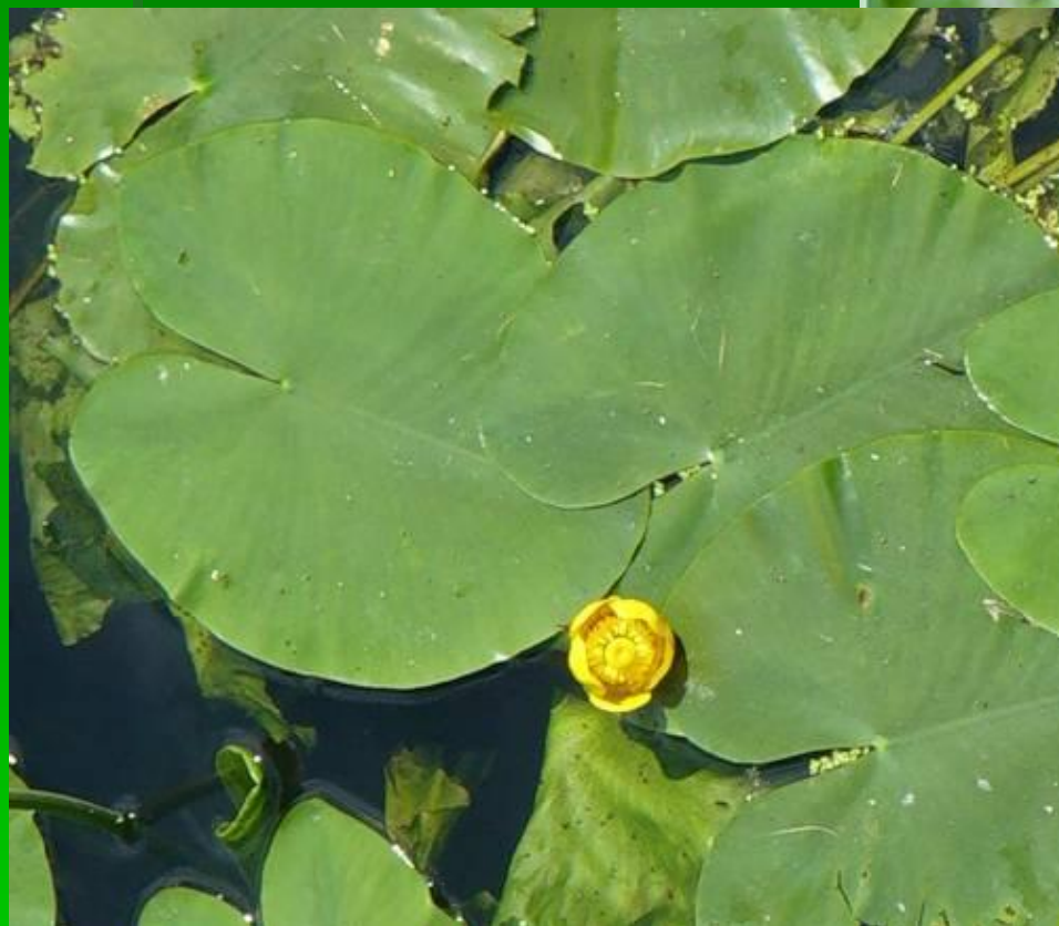
Кубышка (жёлтая кувшинка)