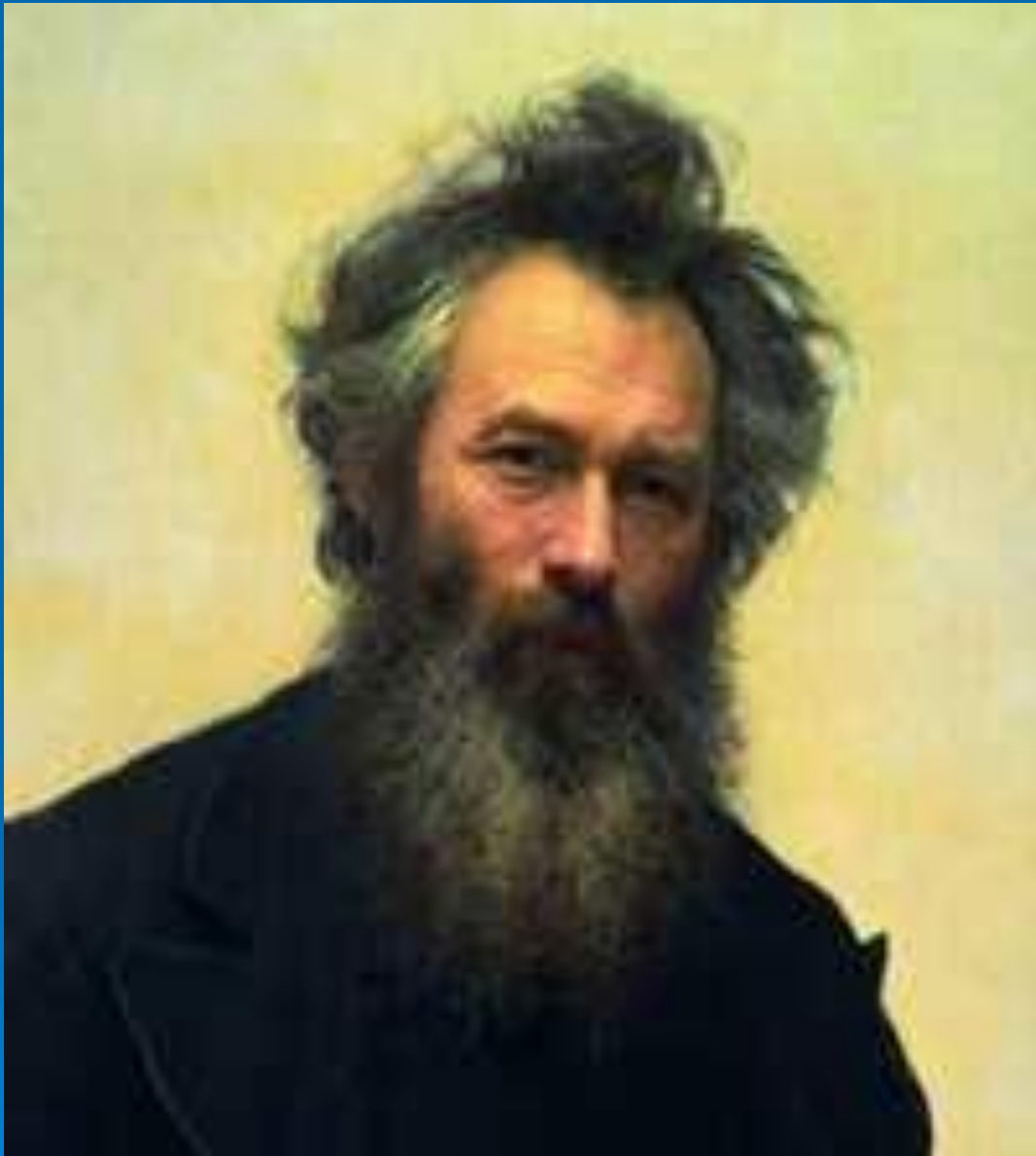
Шишкин Иван Иванович 1832-1898