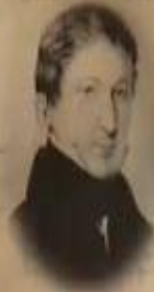
МАТВЕЙ МУРАВЬЁВ- АПОСТОЛ