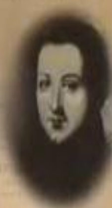
МИХАИЛ БЕСТУЖЕВ- РЮМИН