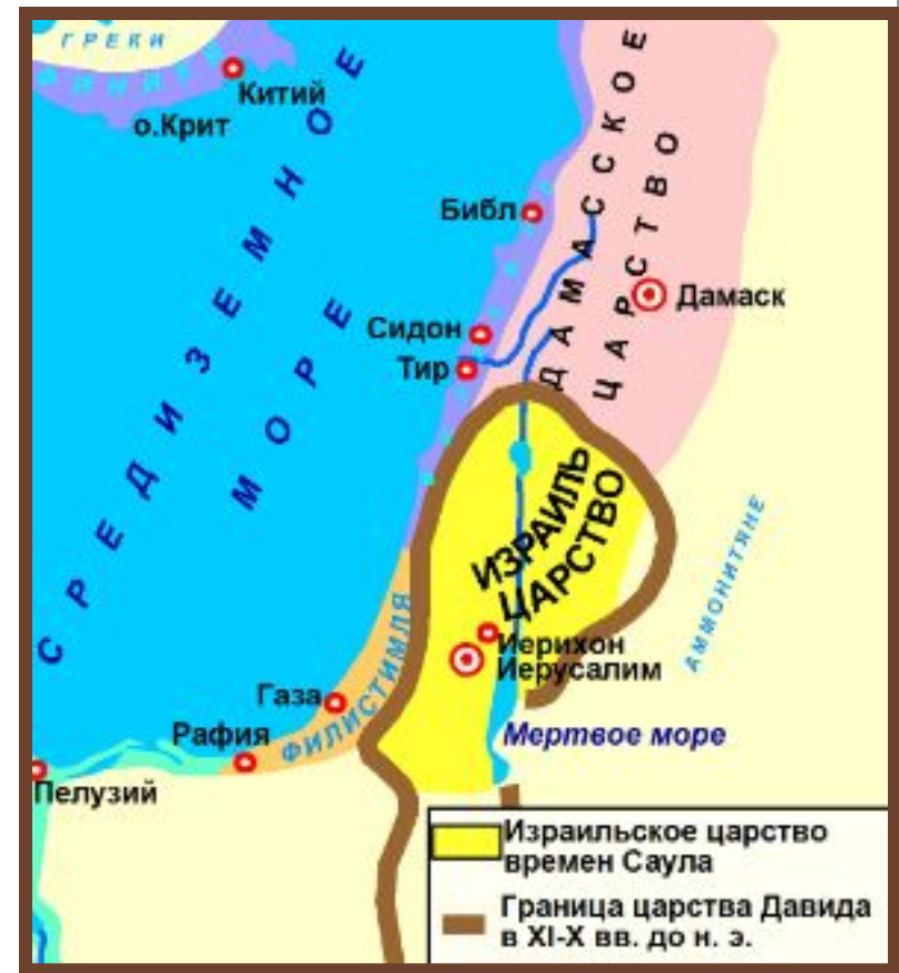
Израиль в древности

В первой половине I тысячелетия до н. э. новое политическое образование сложилось и на юге Восточного Средиземноморья. В XIII в. до н. э. племенной союз двенадцати древнееврейских племен, именуемых коленами, вторгся на территорию Палестины и подчинил себе ряд местных ханаанейских городов-государств.