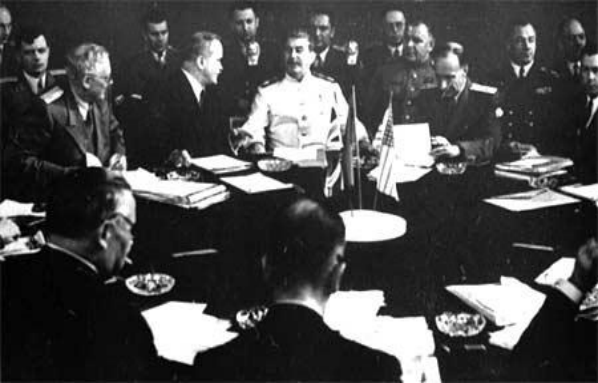
Заседание ГКО май 1943 года.