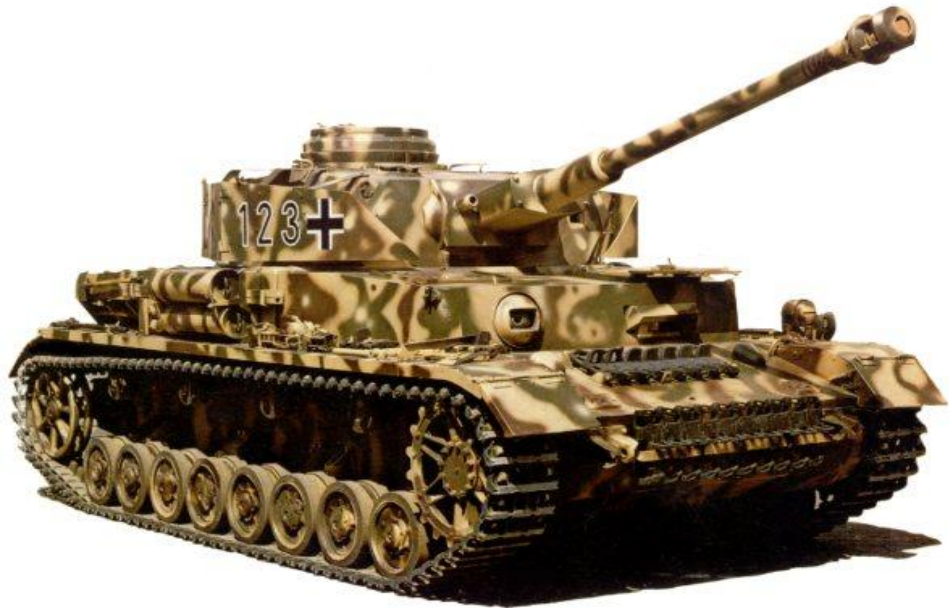
Танк группы «ТИГР»