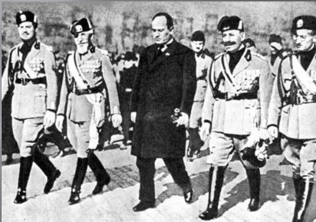
Конвой ведёт арестованного Муссолини, 3 сентября 1943 г.

В июле 1943 г. англо-американские войска высадились неожиданно на юге Италии. По приказу итальянского короля Муссолини был арестован. Германия срочно перебросила в Италию войска, но занять всю Италию им не удалось. Вблизи Неаполя фронт стабилизировался.