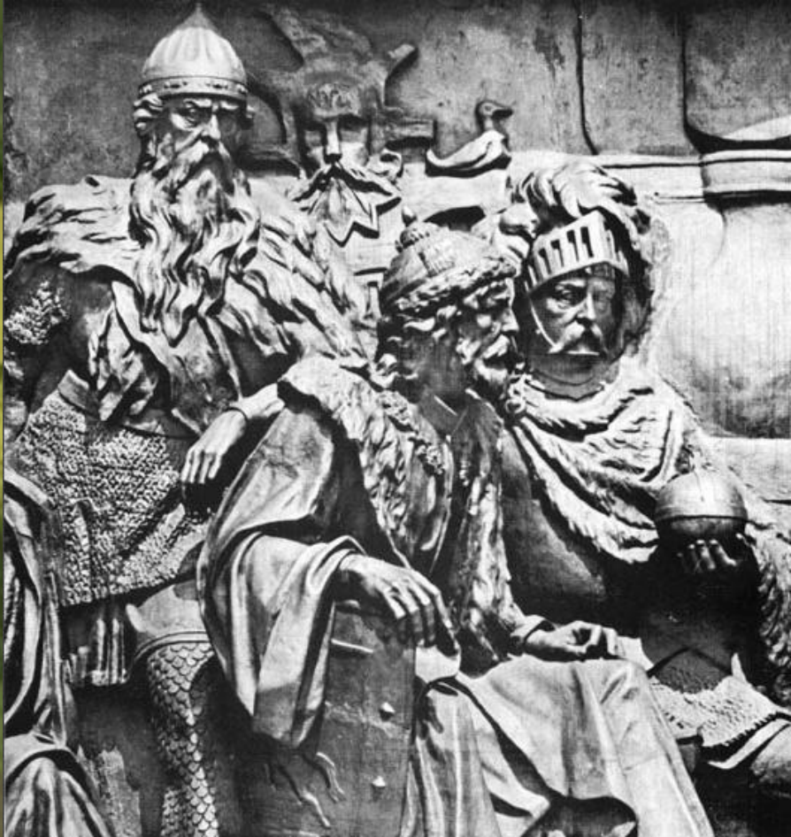
Гедимин, Ольгер, Витовт

Своего расцвета Литовское государство достигло при князе Гидемине. На полоцкий престол литовский князь посадил своего брата.