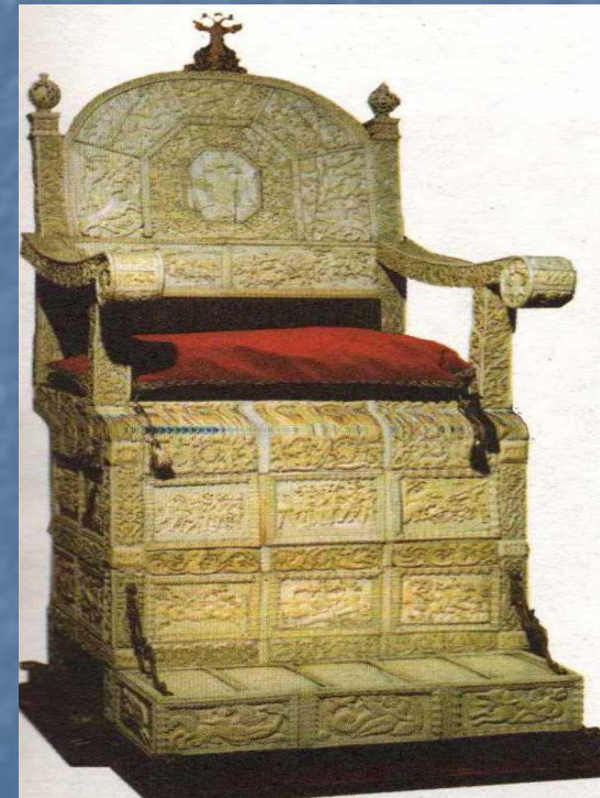
Трон Ивана Грозного