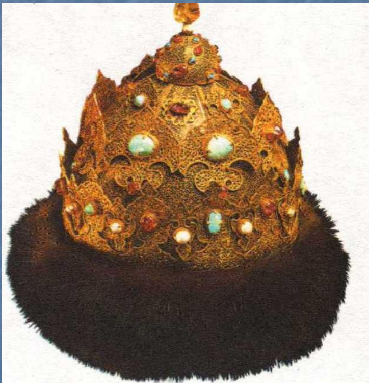
Шапка казанская – корона Ивана Грозного

16 января 1547 г. состоялась торжественная церемония – венчание на царство. Царский титул Ивана IV «Царь и Великий князь всея Руси и Московского государства» был официально подтвержден константинопольским Патриархом.