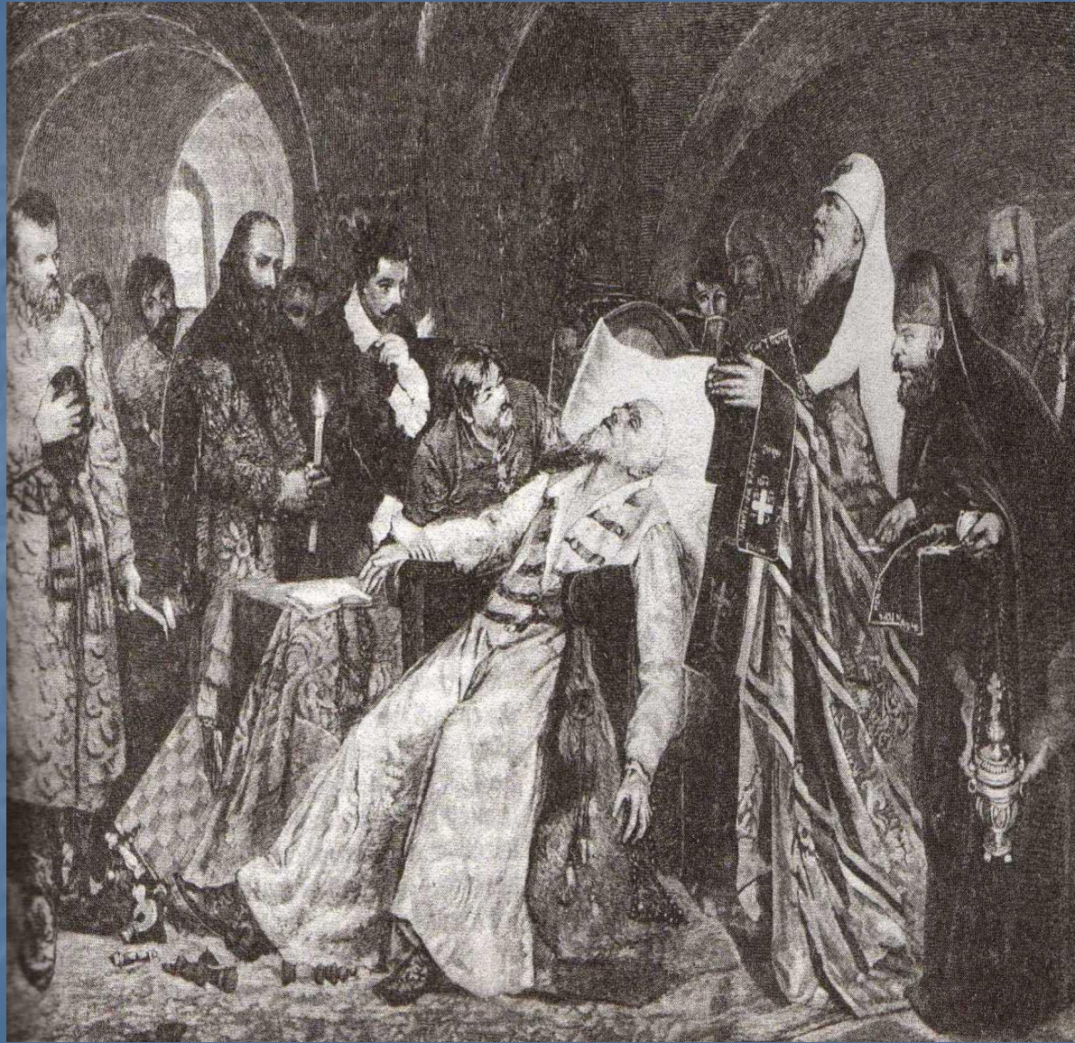
Иллюстрация А. Майман «Смерть Ивана Грозного»