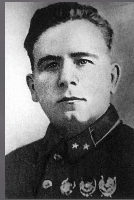
Генерал армии П. Понеделин.