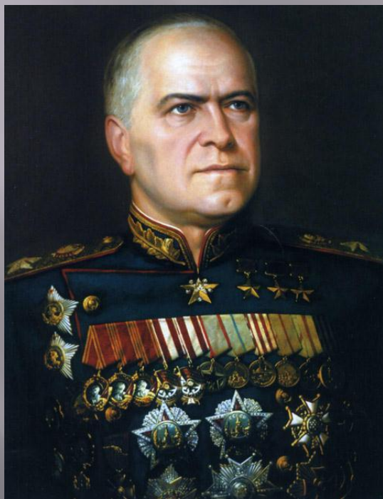
Маршал Советского Союза Г.К.Жуков.