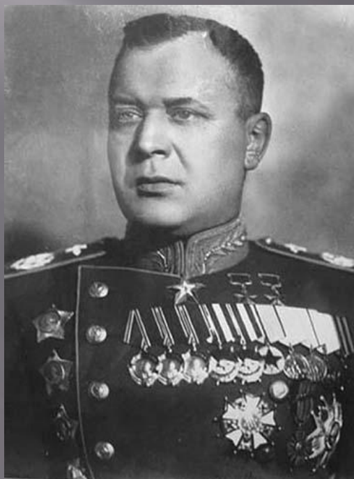
Маршал авиации А. Новиков