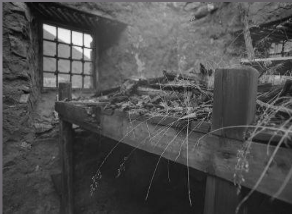
Нары в лагере

Данные о численности заключённых в этот период колеблются от 4,5 до 15 млн. человек. Количество лагерей – 165