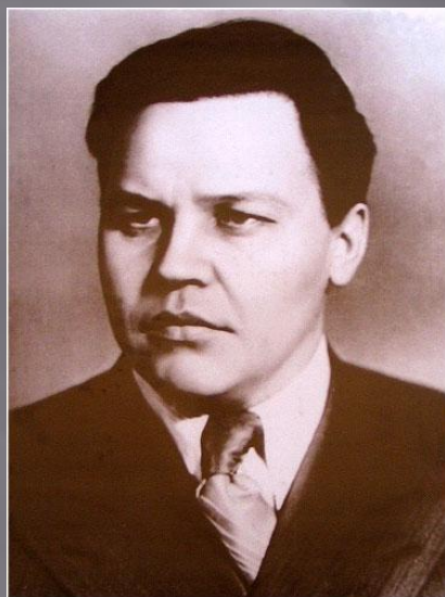
Председатель ГосПлана СССР Вознесенский