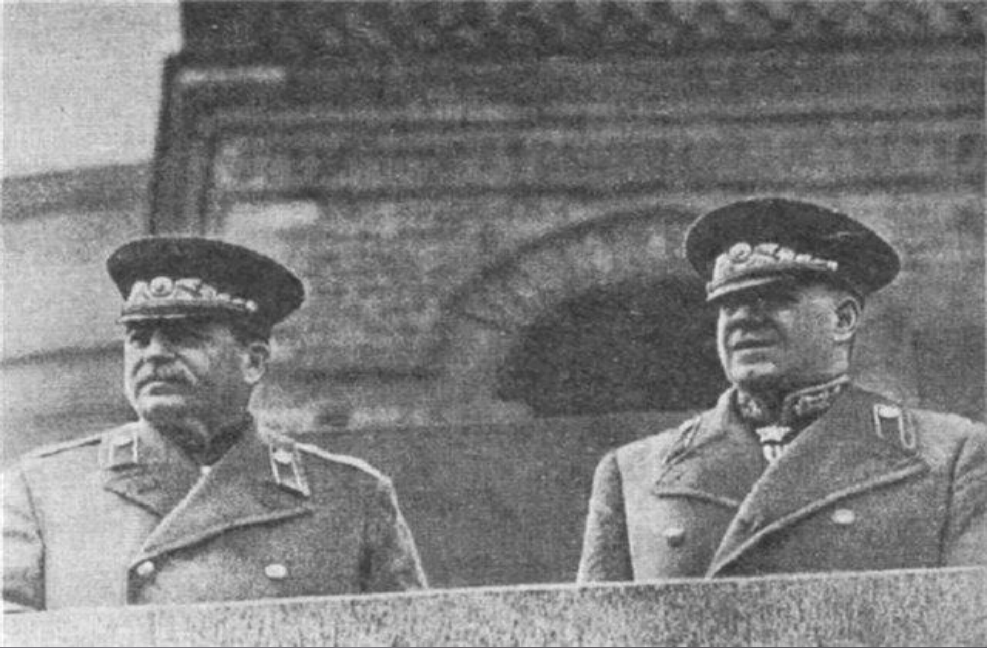
Сталин и Жуков на трибуне мавзолея Ленина в Москве.