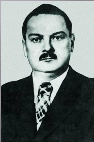
Секретарь ЦК ВКП (б) Жданов.

После войны продолжилось «Ленинградское дело». Были арестованы многие деятели и соратники бывшего секретаря ВКП(б) Жданова. Число арестованных превысило 2000 человек. 200 из них было расстреляно, в том числе Председатель Совмина РСФСР Родионов, член Политбюро и Председатель Госплана СССР Вознесенский и др.