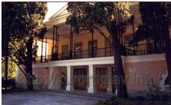
Дом –музей А.С. Пушкина в Гурзуфе