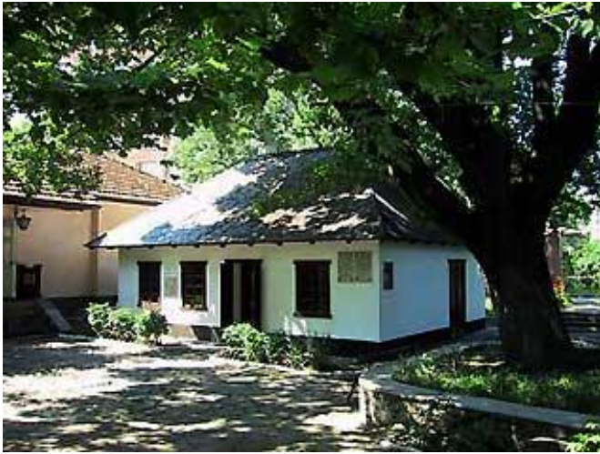
Дом-музей А.С.Пушкина в Кишиневе