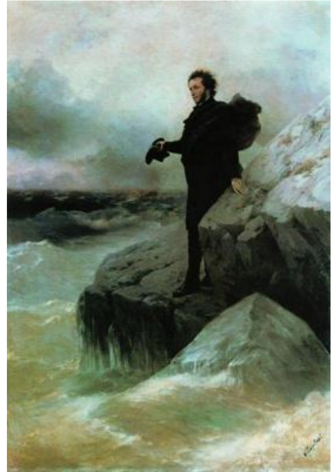
И. Айвазовский Прощание А. С. Пушкина с морем.