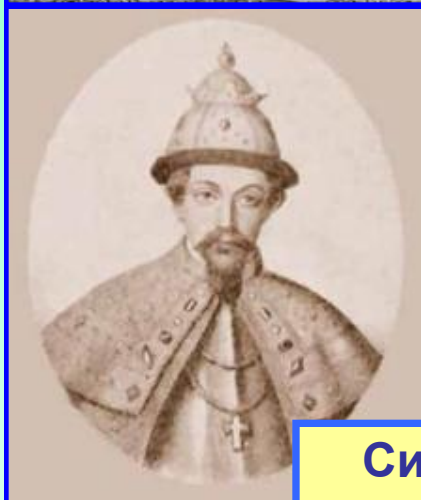
Симеон Иванович Гордый

Ольгерд Гедиминович, пользуясь противостоянием Москвы и Твери продолжал активную политику по расширению и укреплению литовско-русского государства.