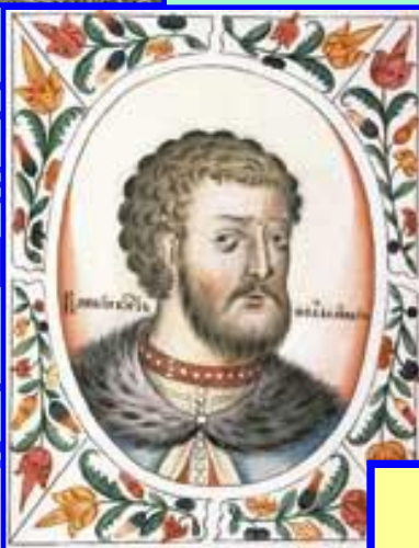
Иван Иванович Красный

Противостояние Москвы и Вильно опиралась на Орду, а Тверь держивалась на Новгородские силы, в том числе на другие русских городах. Следовательно правили Иван Иванович Красный и Иван Иванович Гордый.