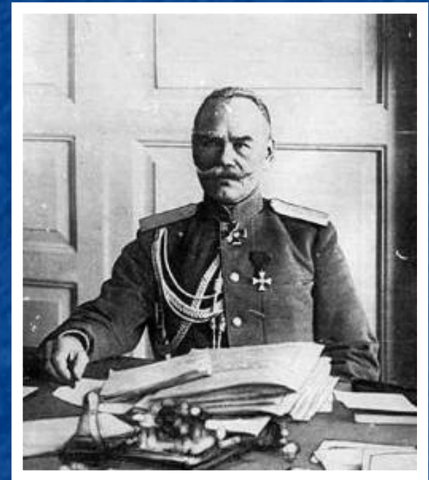
Верховный руководитель Добровольческой армии А.В.Алексеев

Дальний Восток: высадка американских и японских войск.