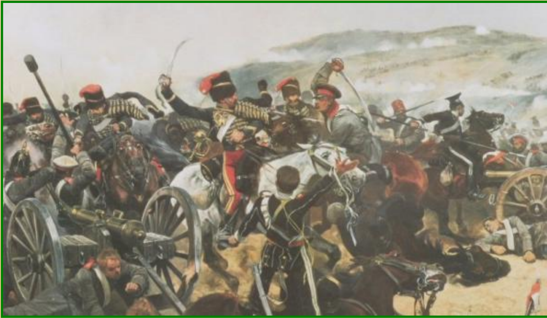
Сражение русской и английской кавалерии

Затягивание боевых действий и большие потери вызывали недовольство в Англии и Франции.