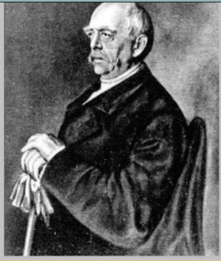
Отто фон Бисмарк