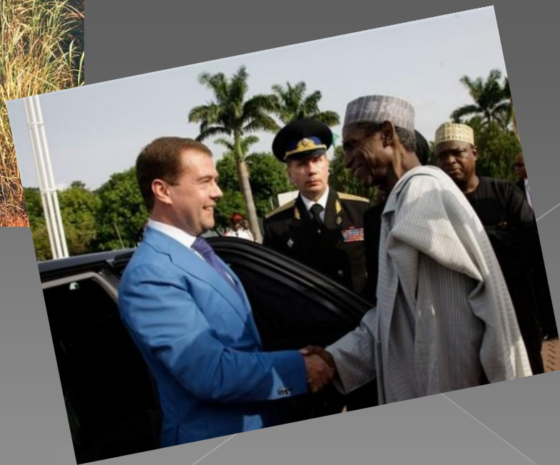
Нигерия, г. Локоджа, октябрь 1993г.