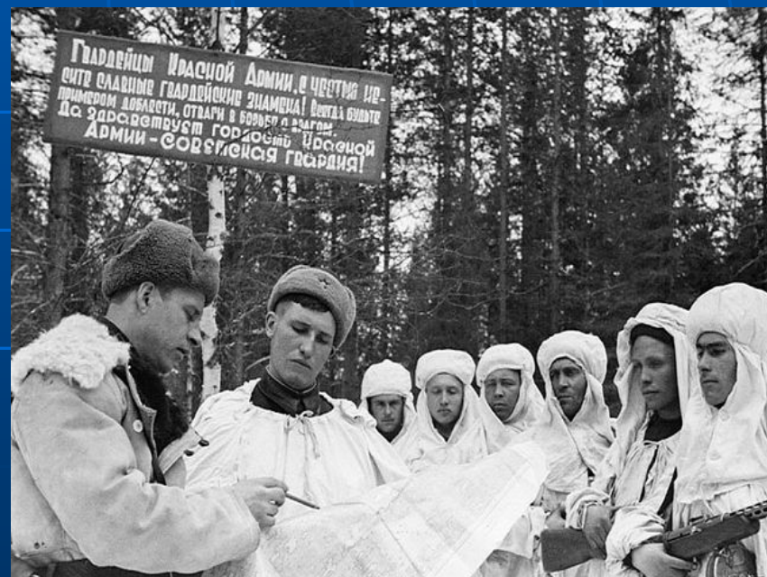
Разведчики получают боевое задание