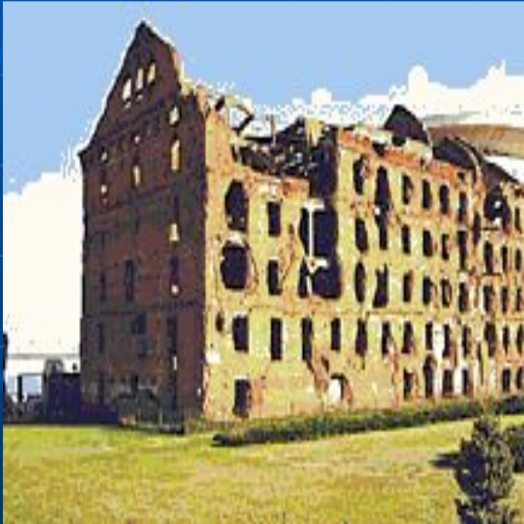
Волгоград. Дом Павлова.