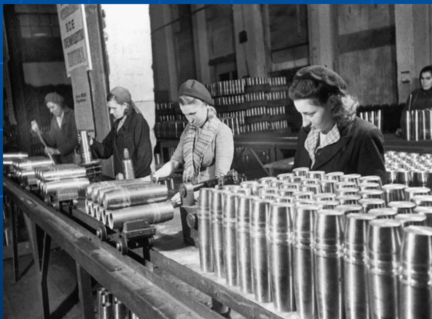
На артиллерийском заводе