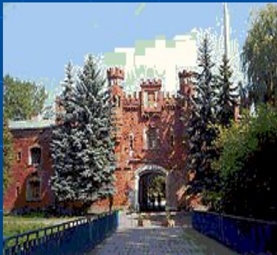
Брестская крепость. Холмский ворота.