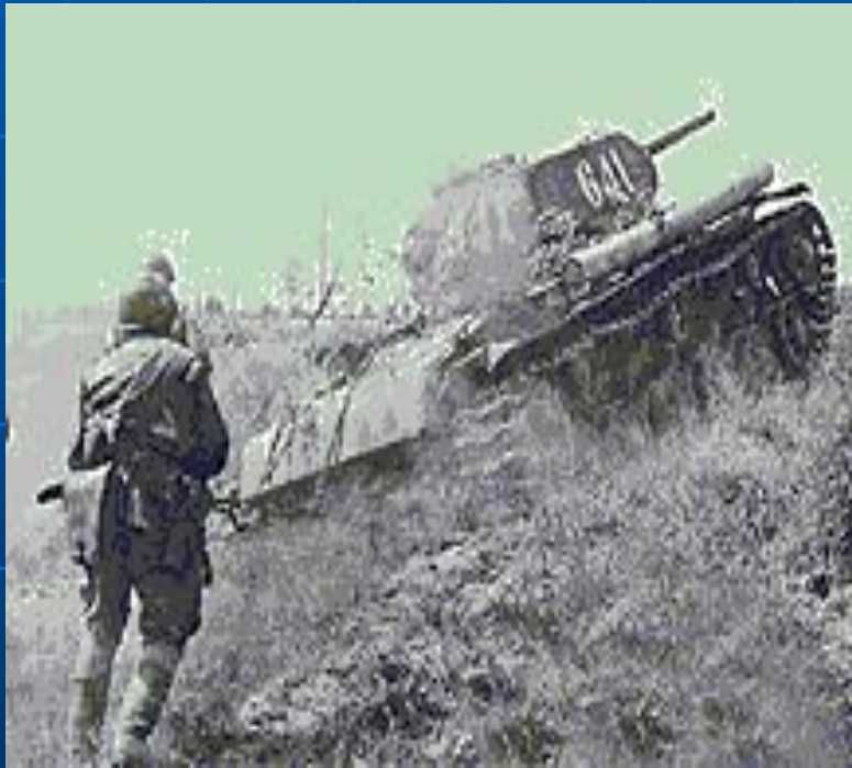
Курская битва. Пехота идёт в атаку под прикрытием танков