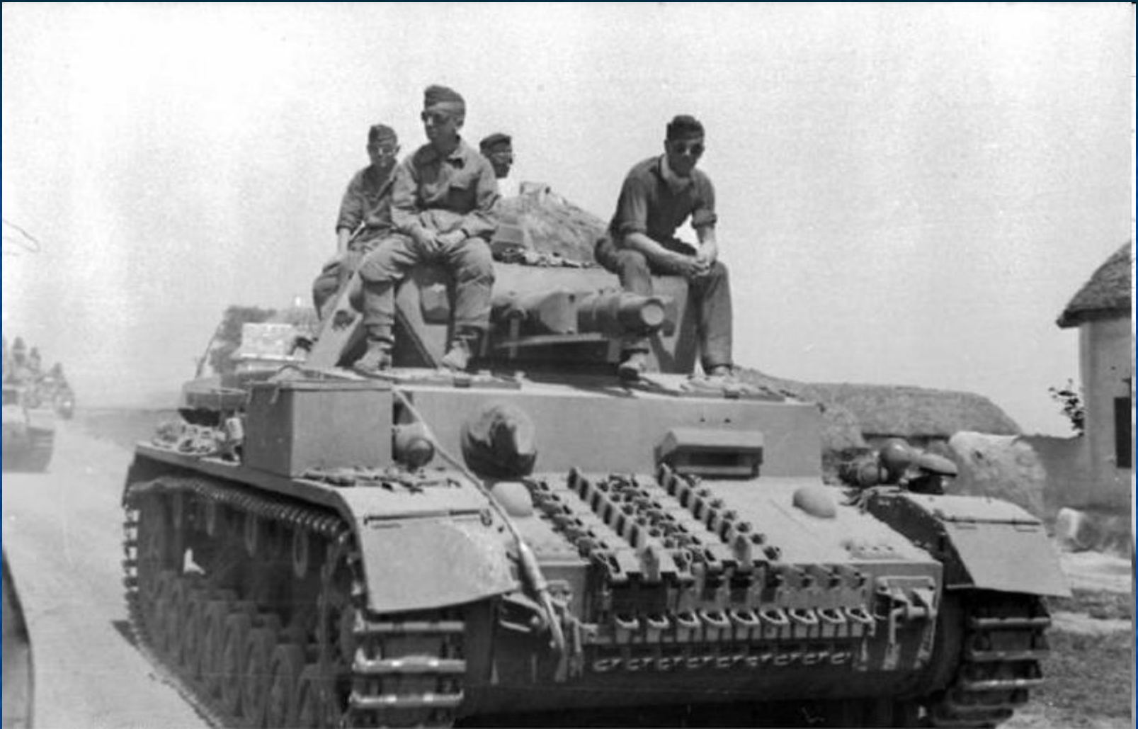
Наступление немецких войск.