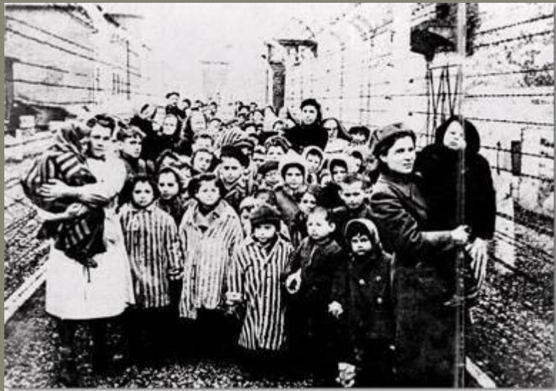
Освобожденные узники Освенцима