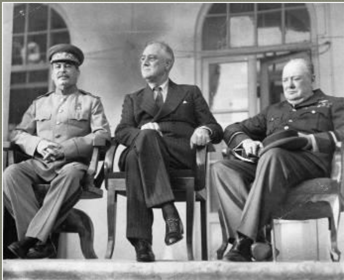
И.В. Сталин, Ф.Д.Рузвельт, У. Черчилль