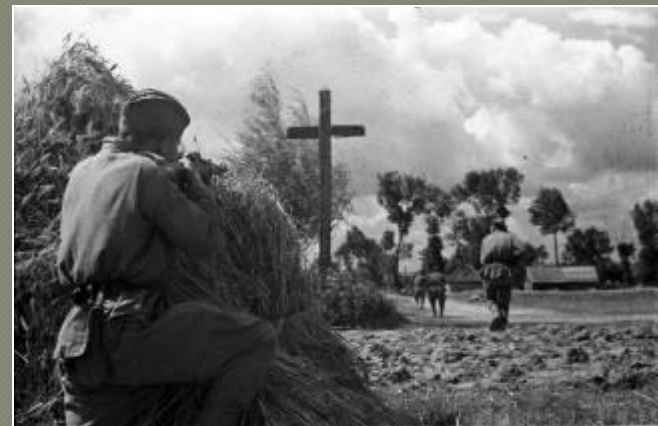
Бои у г. Познань