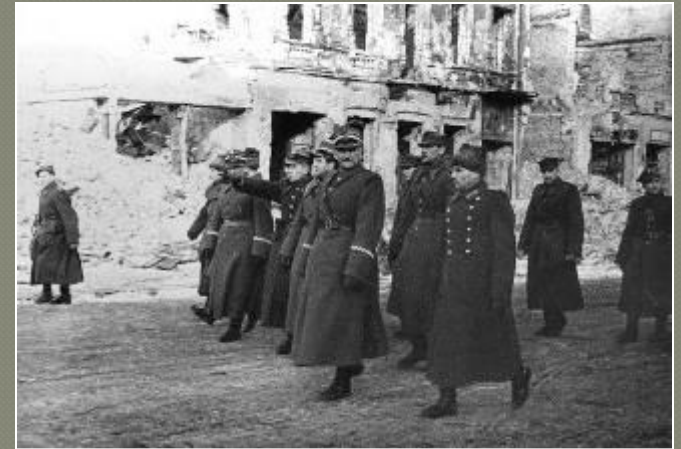
Советские и польские офицеры на улицах Варшавы

Освобождение Польши и перенос действий на территорию Германии