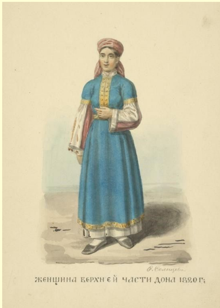
ЖЕНЩИНА ВЕРХНЕЙ ЧАСТИ ДОНА 1820 Г.

Сукман— верхняя одежда замужних казачек (разновидность сарафана). Это накладная одежда, чаще всего синего или черного цвета, шитая из четырех полотнищ ткани, отличался очень узкими и короткими рукавами. Спереди от ворота шел короткий прямой разрез на медных пуговицах, называемых «базка», «пазука» и обшитый широкой шелковой лентой по краям. Цветной шнур, идущий по одному из краев пазуки и в соответственных местах не пришитый к нему, образовывал петли. Вдоль подола сукман обшивался широкой шелковой лентой красной или синей, а по самому краю гарусском (род тесьмы, плетеной особым образом на пальцах). Сукман подпоясывался плетеным красным или синим поясом с кистями.