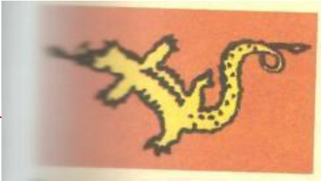
Ұлы ғұндар туы