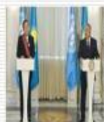
БҰҰ басшысы Пан Ги Мунмен кездесу