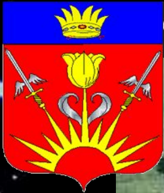
Герб МО ЗАТО Знаменск