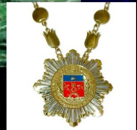
Цепь мэра ЗАТО Знаменск