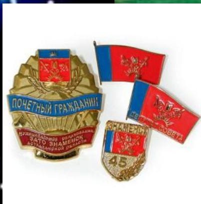
Почетные знаки ЗАТО Знаменск