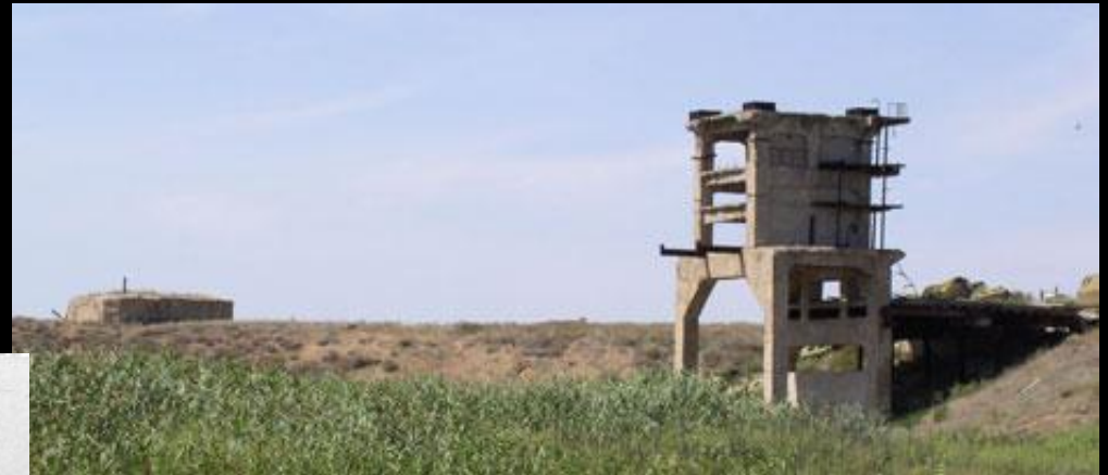
Останки стенда и бункера 56 лет спустя

На полигон первые офицеры прибыли 20 августа 1947 года. Разбили палатки, организовали кухню, госпиталь. Условия были тяжелыми. Уже на третий день в 10 километрах от села началось строительство бетонного стенда для огневых испытаний двигателей и бункер для наблюдения за ходом испытаний.