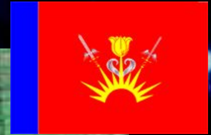
Флаг МО ЗАТО Знаменск