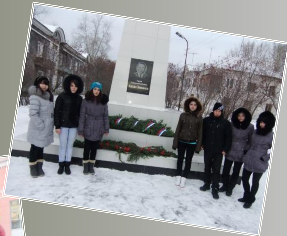
К памятнику Хасана Заманова