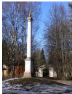
Колонна Орла Ринальди