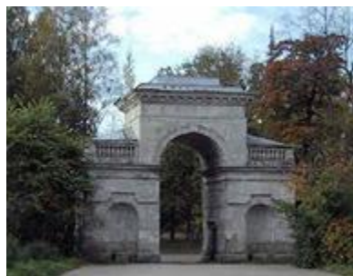
Берёзовые ворота. Брэнна