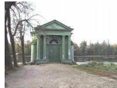
Павильон Венеры. Брэнна