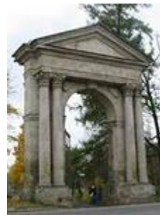
Адмиралтейские ворота. Брэнна