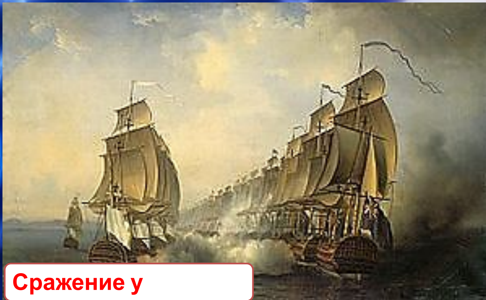
Сражение у Куддалора

Конец 1781—1782 годов — произошли несколько морских сражений и ряд мелких столкновений на суше. 20 июня 1783 года — Сражение у Куддалора — последнее сражение войны США за независимость