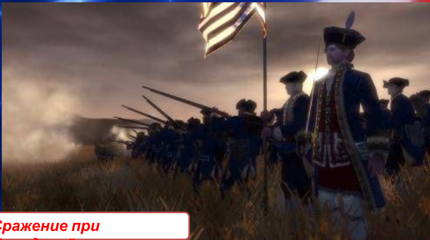
Сражение при Брендивайне

Весной 1776 года Король направил для подавления восстания флот с десантом из гессенских наёмников. Британские войска перешли в наступление. В 1776 году британцы заняли Нью-Йорк, а в 1777 году, в результате сражения при Брендивайне , Филадельфию. На фоне эскалации насилия 4 июля 1776 года депутаты колоний приняли декларацию независимости и образования США. В битве при Саратоге американские сепаратисты впервые одержали победу над королевскими войсками.