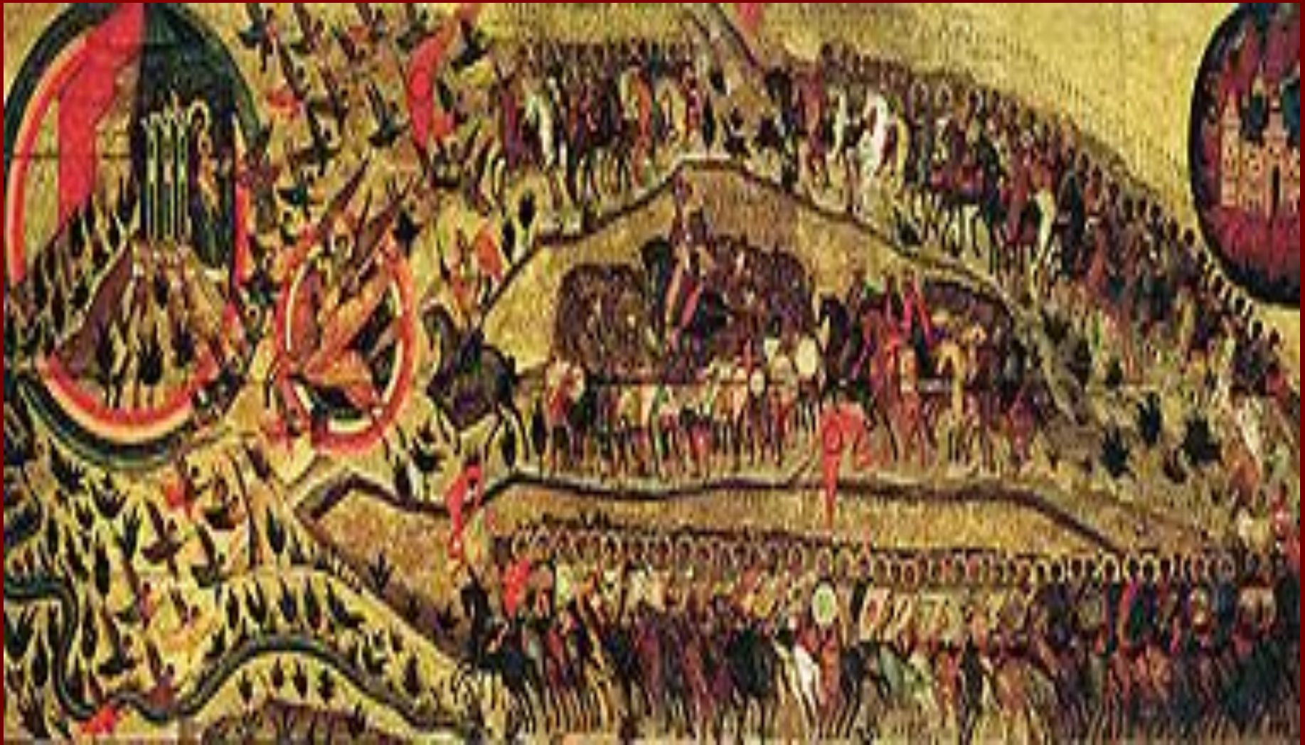
Икона « Благословенно воинство Небесного Царя », написанная в память Казанского похода 1552 года