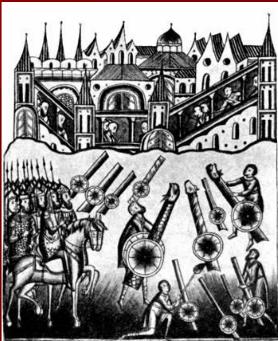
Осада Казани. Из Казанского летописца.

Второй поход (осень 1549 — весна 1550 ). В марте 1549 года Сафа-Гирей внезапно скончался. Приняв казанского гонца с просьбой о мире, Иван IV отказал ему, и начал собирать войско. 24 ноября он выехал из Москвы, чтобы возглавить войско. Соединившись в Нижнем Новгороде, войско двинулось к Казани и 14 февраля было у её стен. Казань не была взята; однако при отходе русского войска недалеко от Казани, при впадении в Волгу реки Свияги было решено возвести крепость. 25 марта царь вернулся в Москву. В 1551 году всего за 4 недели из тщательно пронумерованных составных частей была собрана крепость, получившая название Свияжск ; она послужила опорным пунктом для русского войска во время следующего похода.