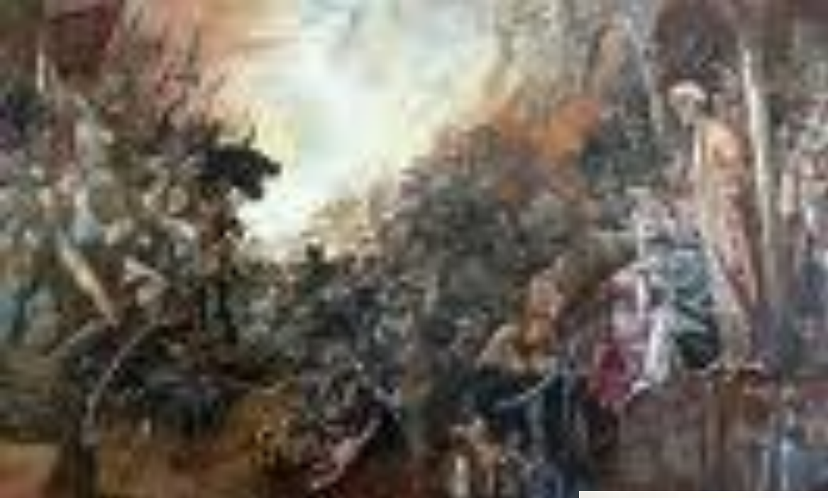
И. Файзуллин "Оборона Казани "