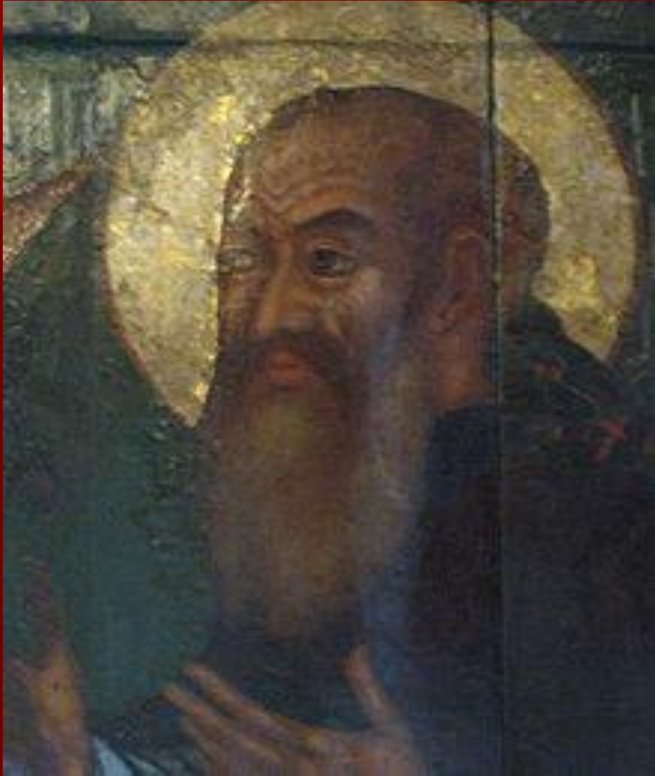
Василий III , отец Ивана IV

Неудачный поход русского войска на Казань в начале 16 века показал правительству Василий III , что необходимо спешно крепить порубежную крепость Нижнего Новгорода. Тогда же началась заготовка кирпича, белого камня, извести, железа и строевого леса, чтобы в возможно короткий срок над слиянием Оки с Волгой поднять неприступной твердыней Нижегородский каменный кремль.