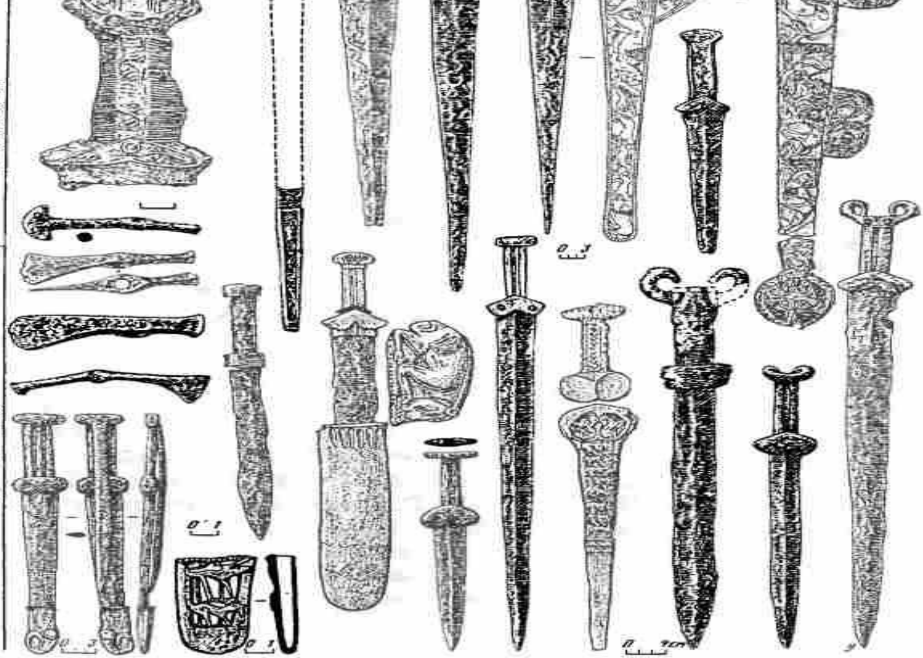
Скифские мечи, ножи и боевые топоры