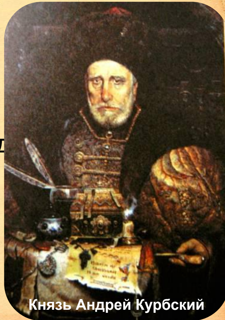
Князь Андрей Курбский