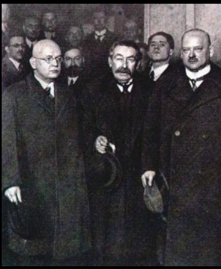
Аристид Бриан. (в центре).

Появилось огромное количество теорий о том как преодолеть кризис. Социалисты предлагали ликвидировать капитализм, националисты-установить господство над другими народами. В 1928 г. был подписан пакт Бриана-Келлога, запрещавший войну. Его гарантировали Лига наций и США. К сер.30-х пакт подписали 63 государства.