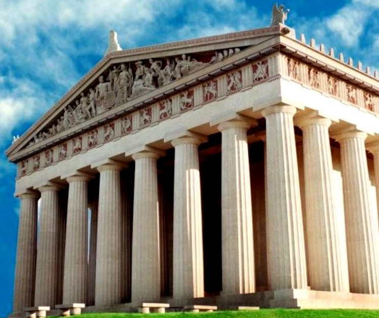
Храм Парфенон в Афинах

http://doseng.org/interesnoe/6015-chudesa-sveta..html