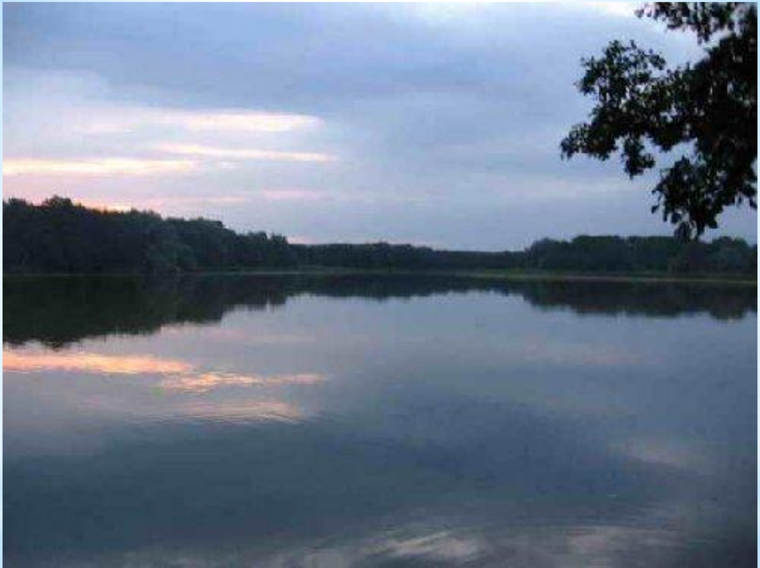
Озеро Песчаное в Богучарском районе