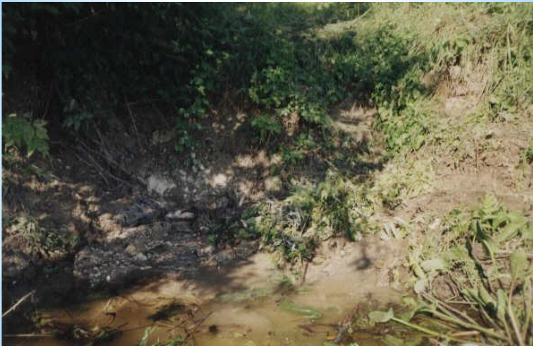
Родник у хутора Антиповка Павловского района