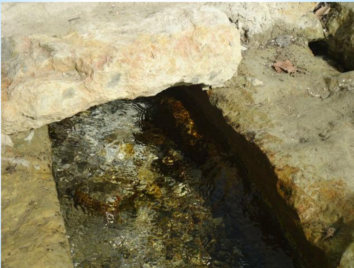
Родник в с. Кисляе Бутурлиновского района