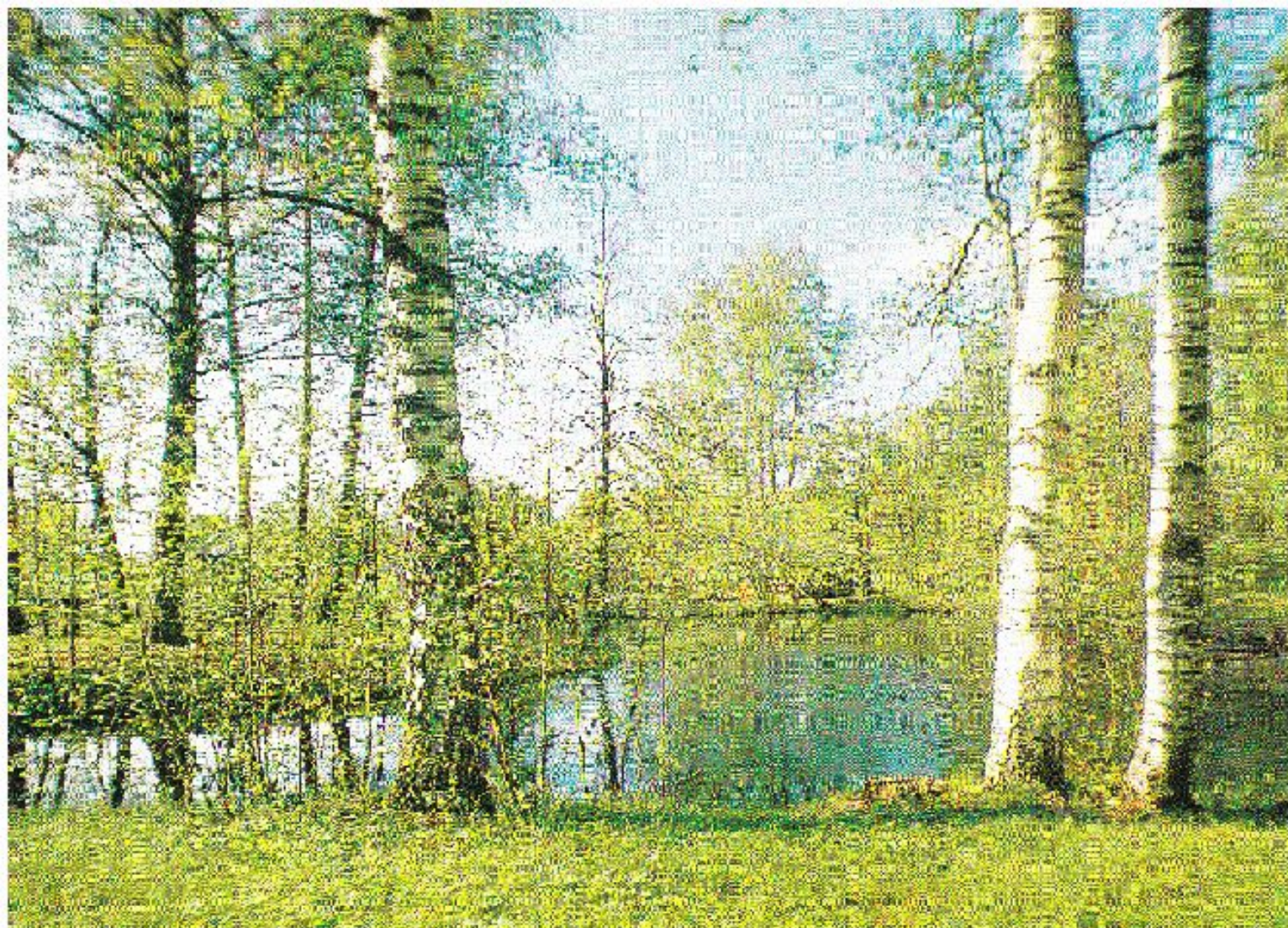
Коротоякский пруд. Острогожский район.