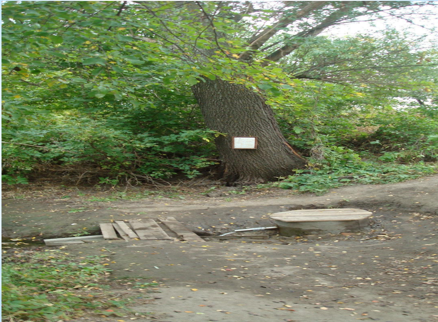
Родник «Берёзовский» в г. Бутурлиновка