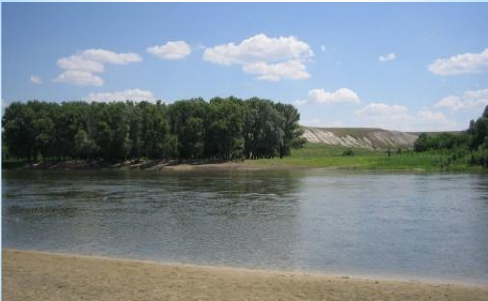
Озеро Рыбное в Богучарском районе