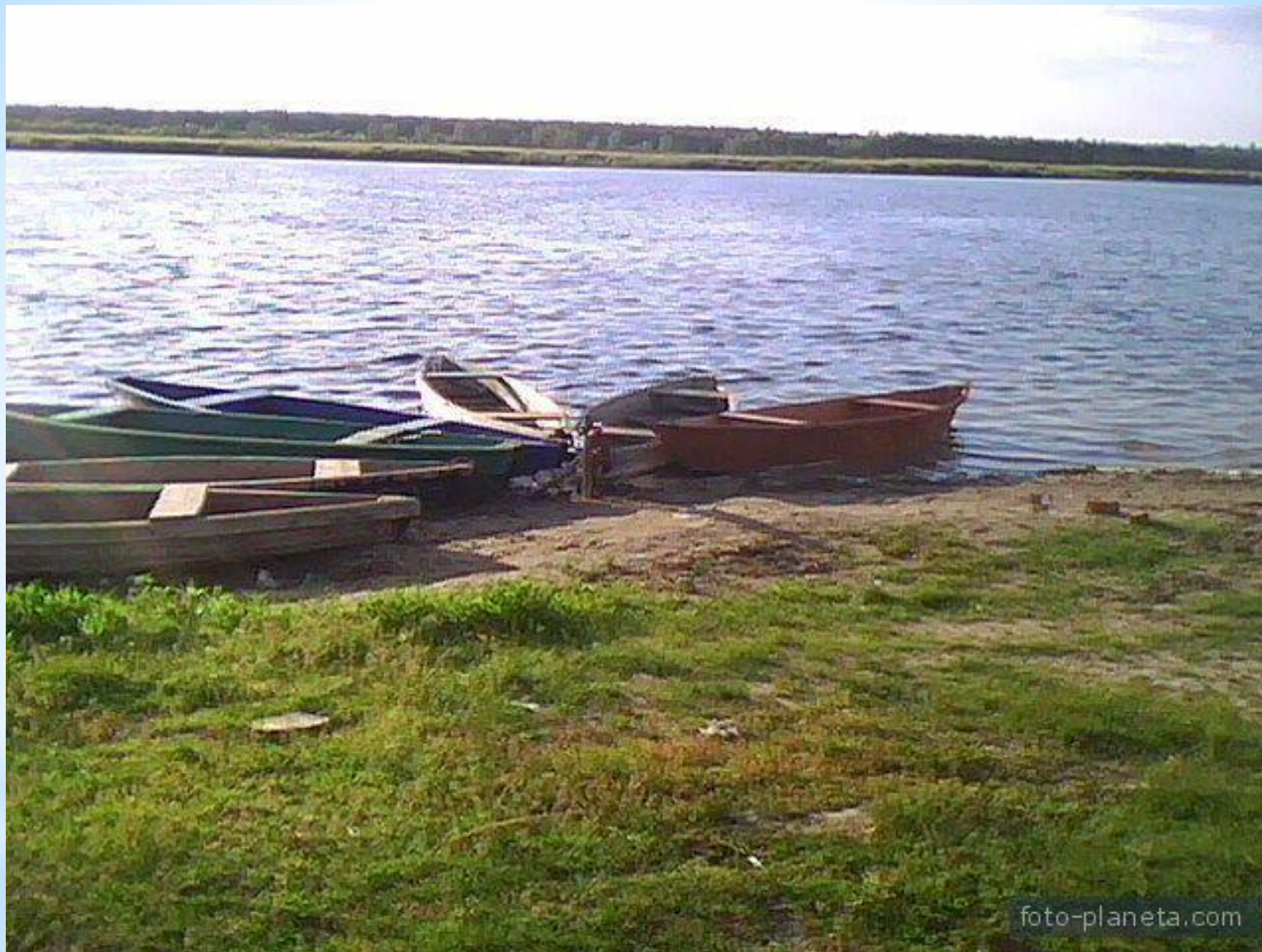
Озеро Ильмень в Поворенском районе