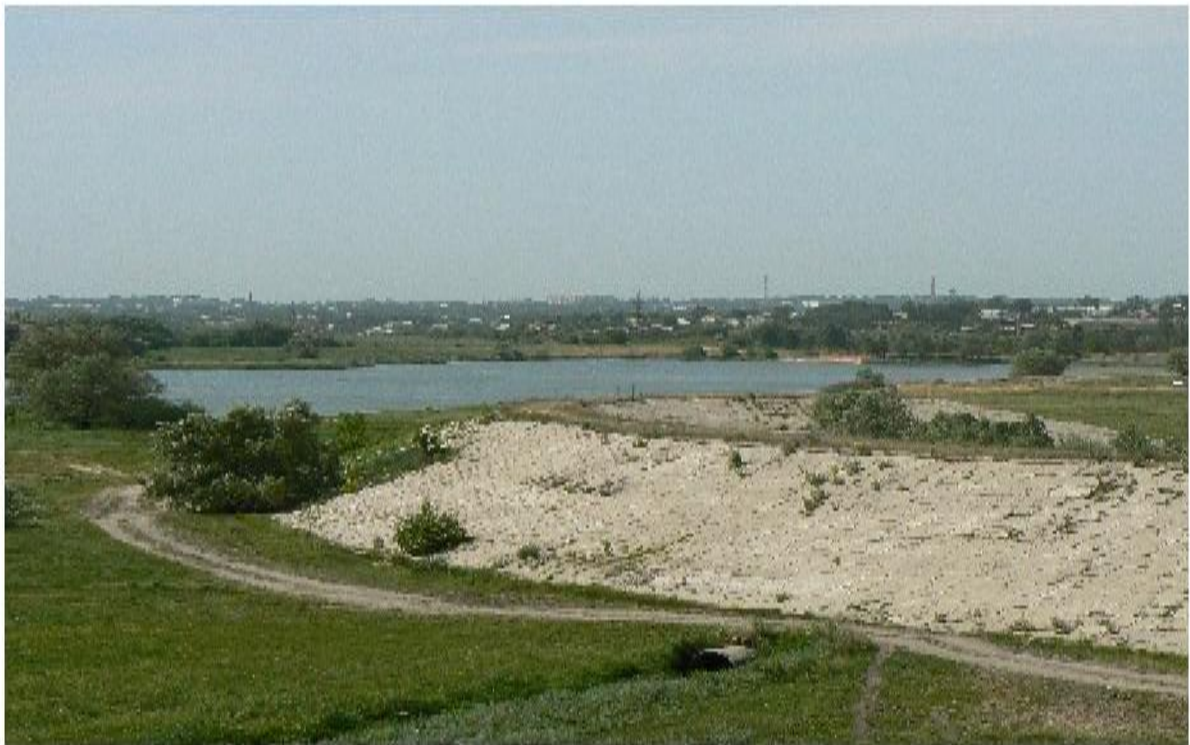
Озеро Кирпичное у города Острогожска.