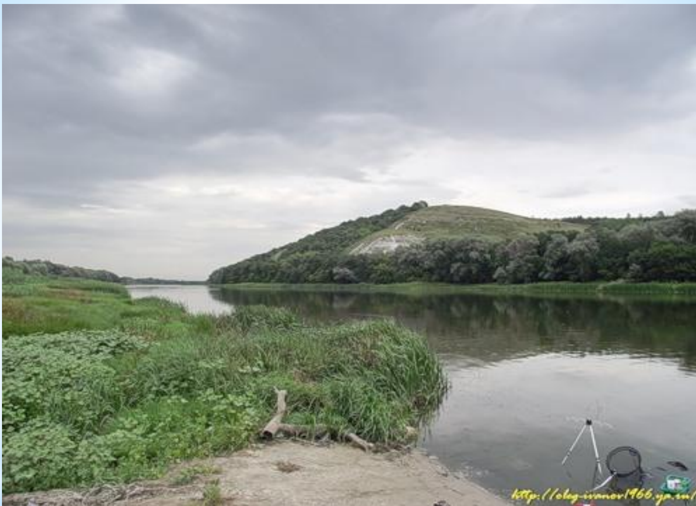
Река Дон на юге Воронежской области