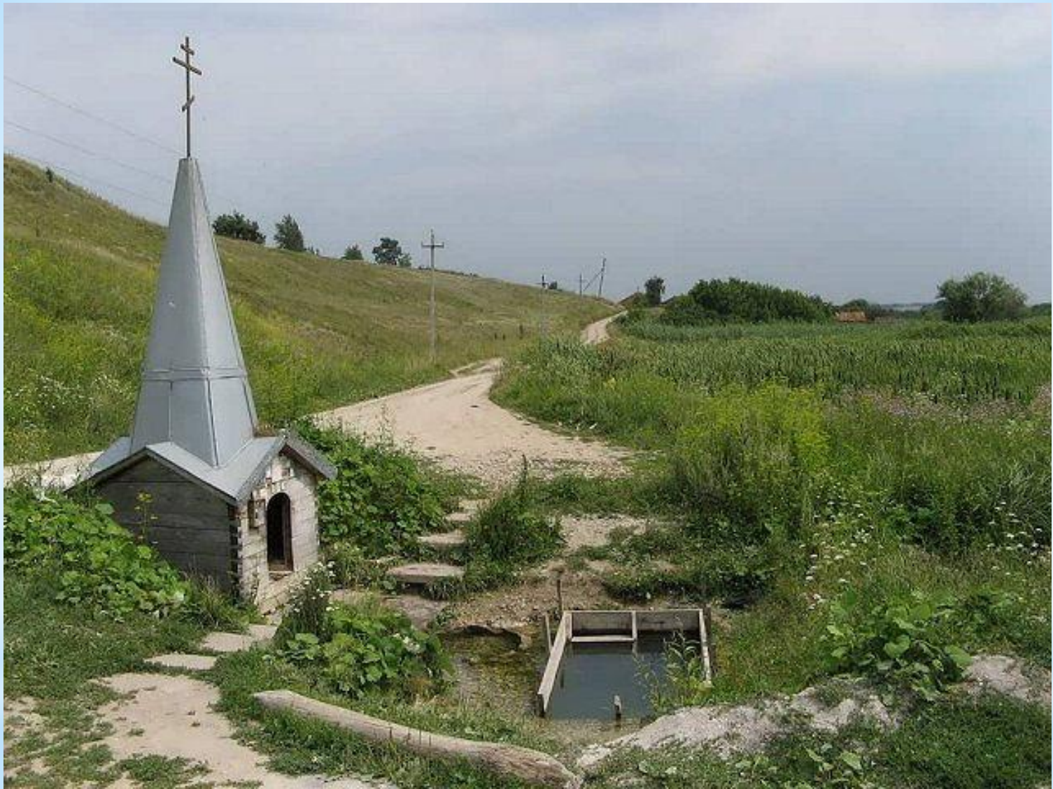
Святой источник в г. Бутурлиновка