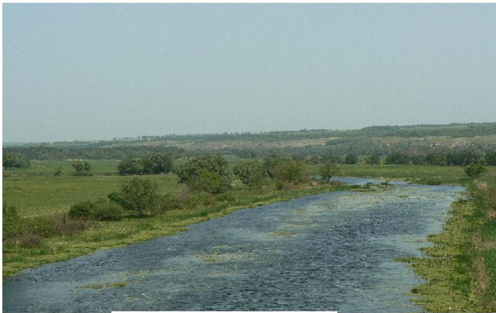
Красавица Тихая Сосна