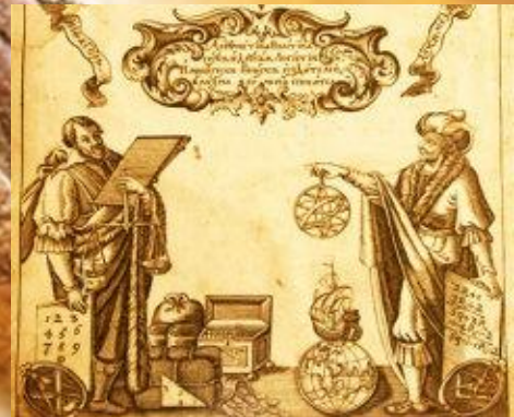
Фронтиспис из "Арифметики" Магницкого. Гравюра на меди М. Карновского