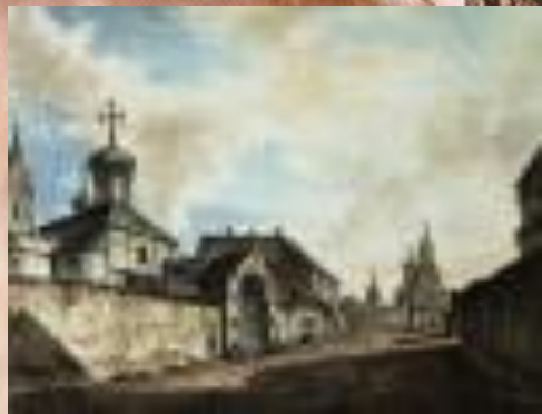
Слева Церковь Гребневской Божьей матери, рядом с которой был похоронен Л.Ф. Магницкий