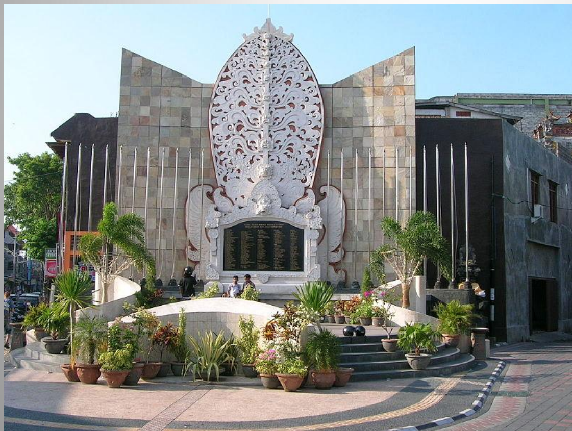
Памятник жертвам теракта 12 октября 2002 года на острове Бали

По оценкам правительства и руководства силовых структур страны, основные угрозы её национальной безопасности носят внутренний характер. Важнейшими из них являются межэтнические и межрелигиозные конфликты и связанные с ними проявления терроризма и экстремизма