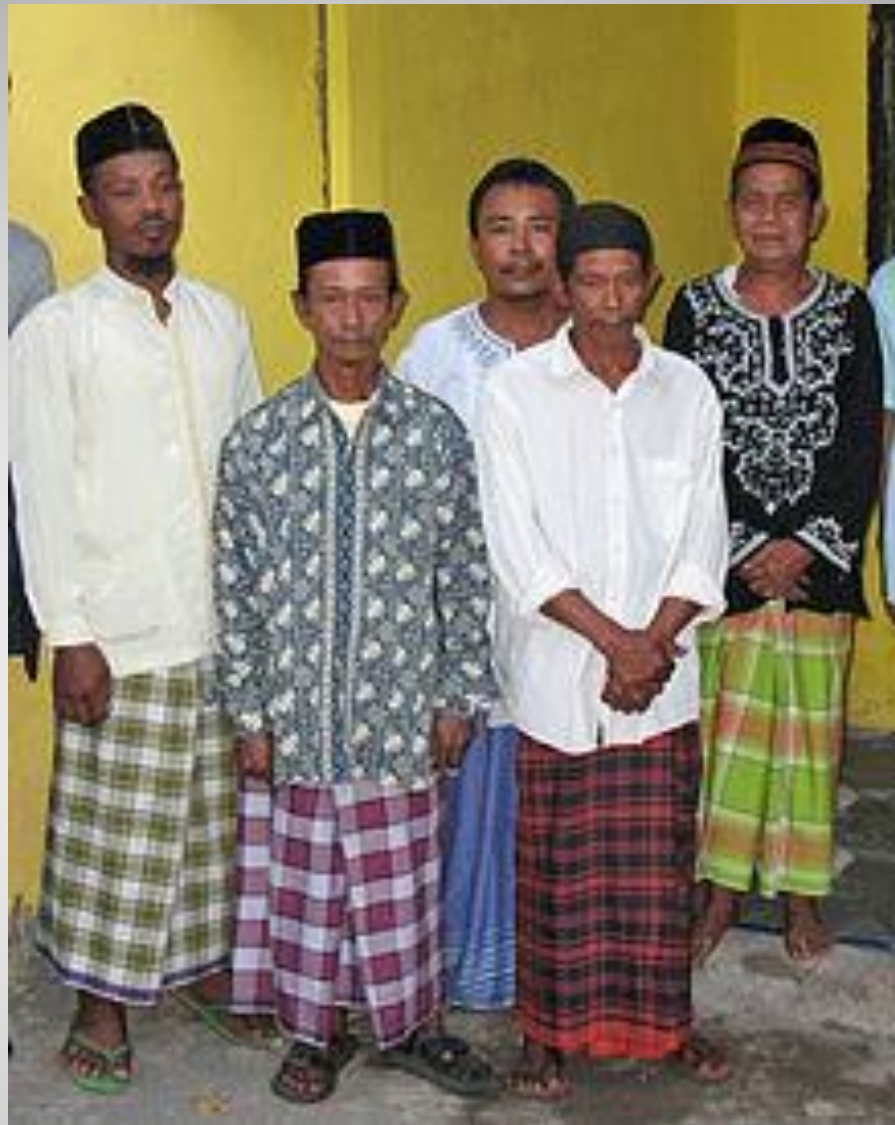
Яванцы, представители крупнейшего народа Индонезии, в национальной одежде