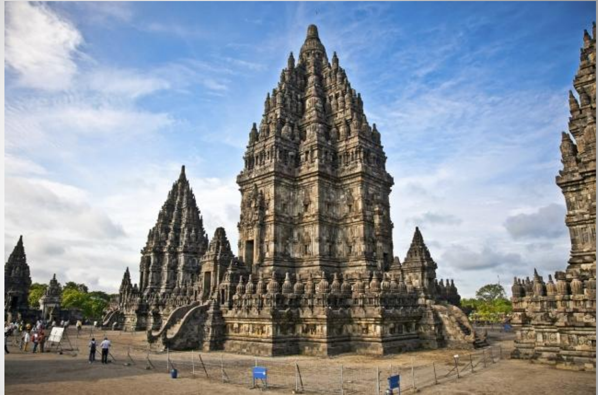
Храмовый комплекс Прамбанан

В частности, на 2012 год в стране имелось 8 объектов, включённых в список Всемирного наследия ЮНЕСКО