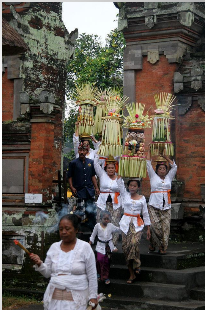
Приношения в индуистский храм, остров Бали