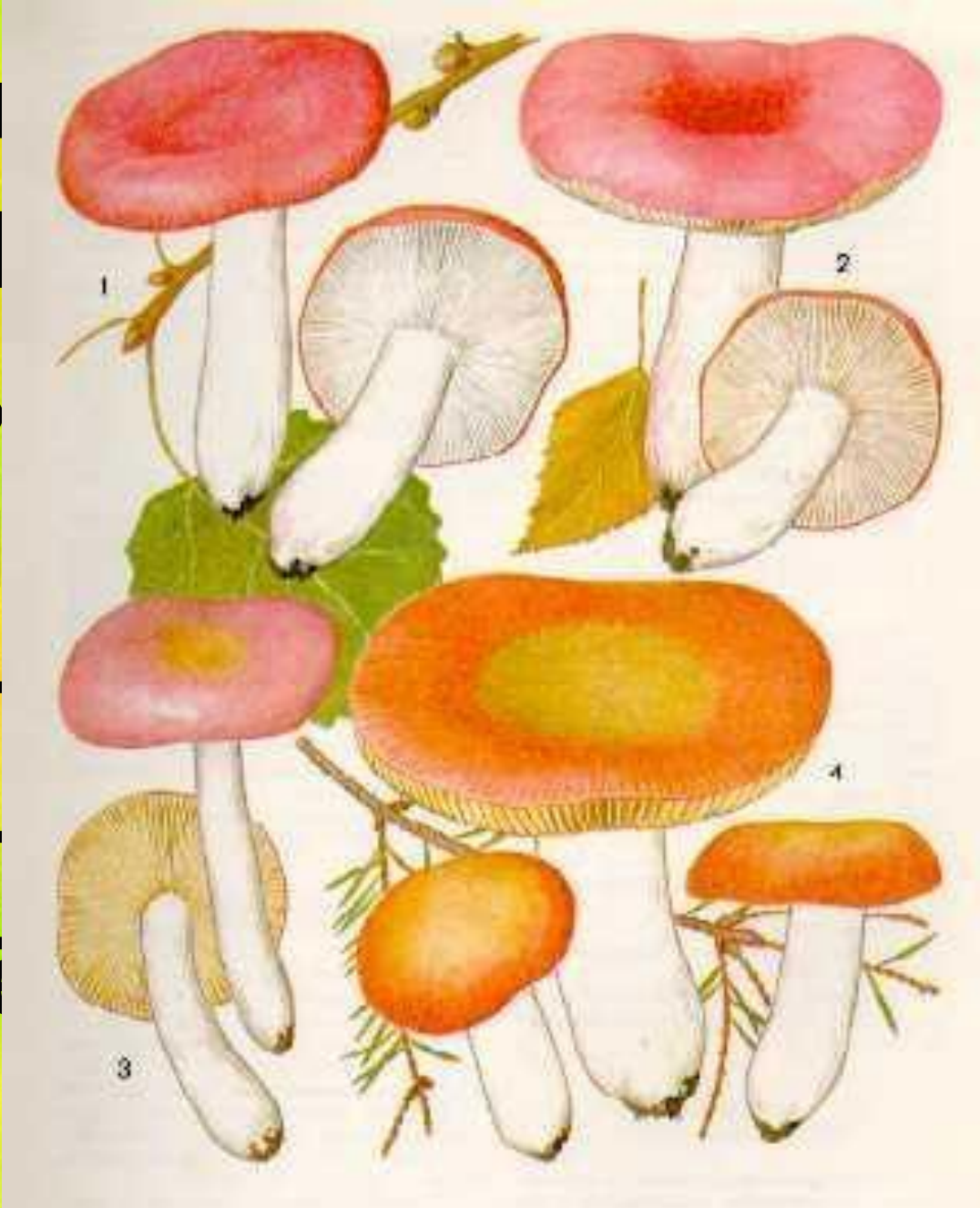
1. LEPISTA SAEVA 2. LEPISTA GYPSARIA 3. LEPISTA HETEROPHYLLA 4. LEPISTA TASHIROAE