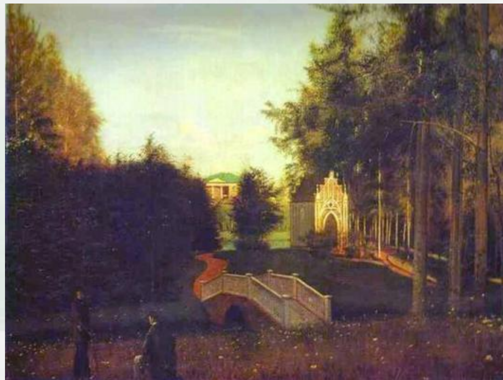
Часовня в парке ~1850г

В 1850-1860-х годах Сорока жил в родной деревне, писал образа для деревенских церквей, пытался следовать примеру Венецианова и учить живописи своих земляков.