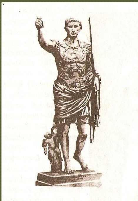
Статуя Октавиана Августа

Античное искусство Греции и Рима показывает красоту физически совершенного человека.