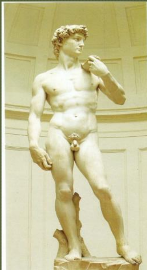
Микеланджело. Давид 1501-1504

Эпоха итальянского Возрождения подарила миру великолепные скульптурные образы и множество живописных произведений.