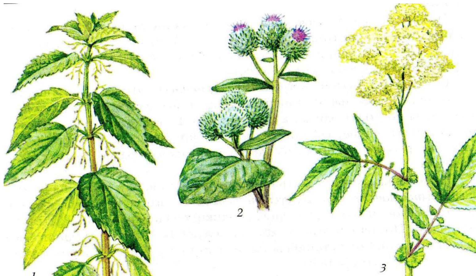
Рис.42. Растения-азотолюбые: 1 – крапива двудомная; 2 – лопух паутинистый; 3 – таволга вязолистная