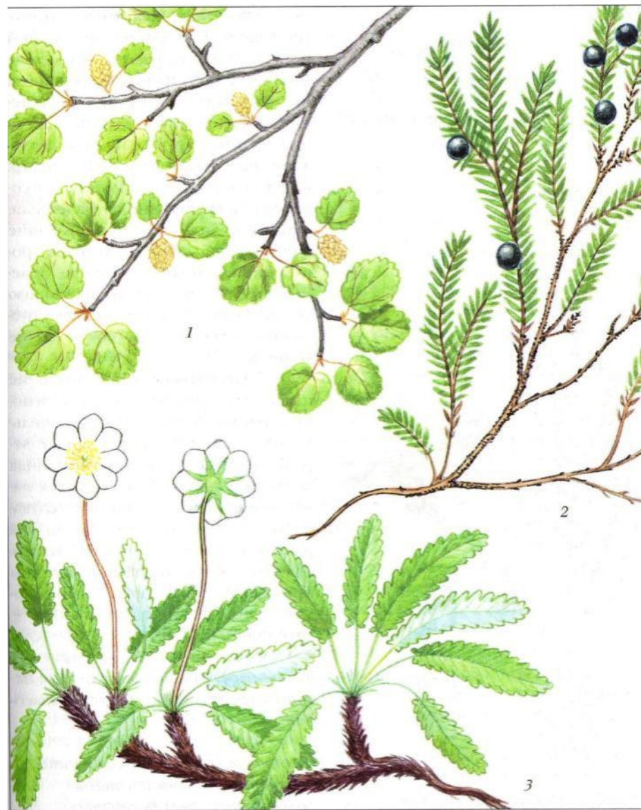
Рис. 43. Тундровые растения: 1 – карликовая березка; 2 – водяника; 3 – куропаточья трава