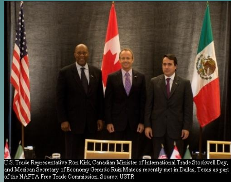
U.S. Trade Representative Ron Kirk, Canadian Minister of International Trade Stockwell Day, and Mexican Secretary of Economy Gerardo Ruiz Mateos recently met in Dallas, Texas as part of the NAFTA Free Trade Commission.