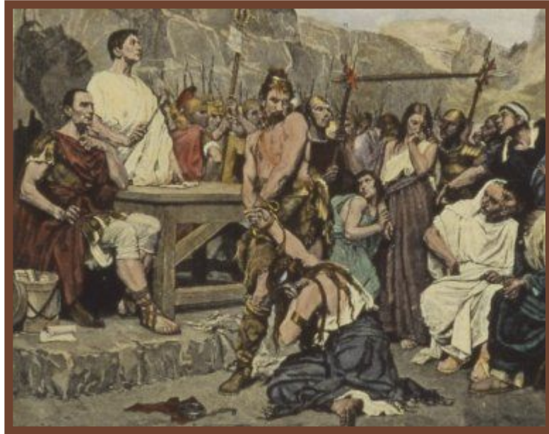
Продажа в рабство за долги