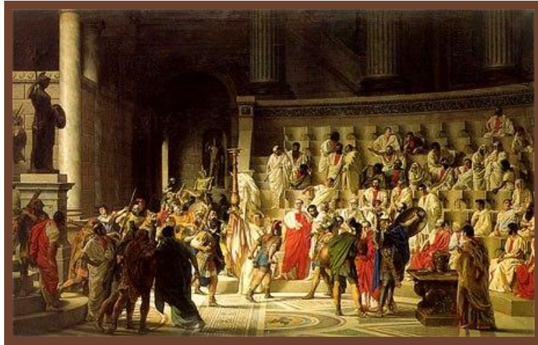
В римском Сенате

Во главе общины Сенат (родоплеменная знать – 100 патрициев).