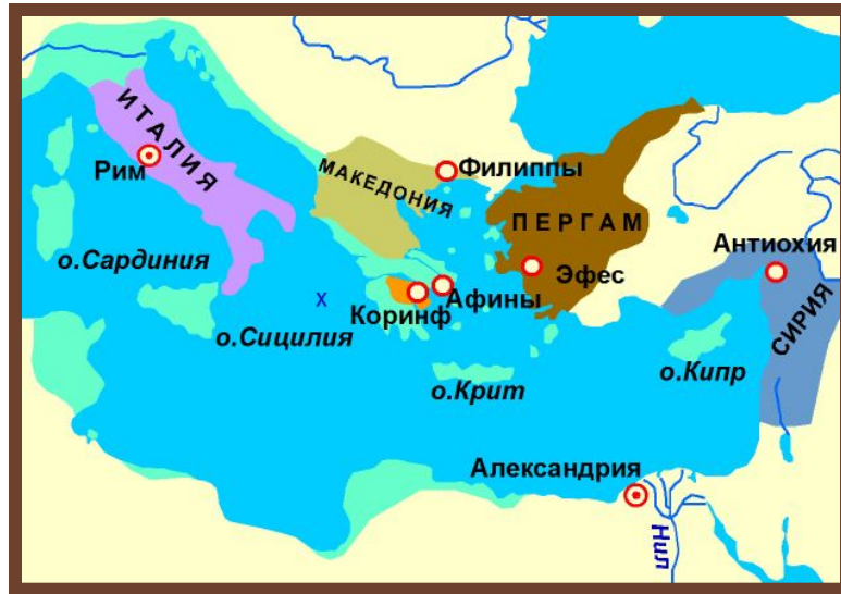
Рим и его провинции времен Республики

III вв. до н. э. – Рим подчинил всю Италию. Соперничество с Карфагеном.