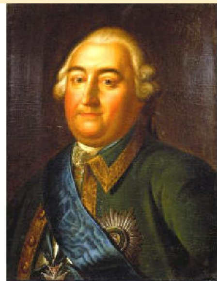
С.Ф. АПРАКСИ Н