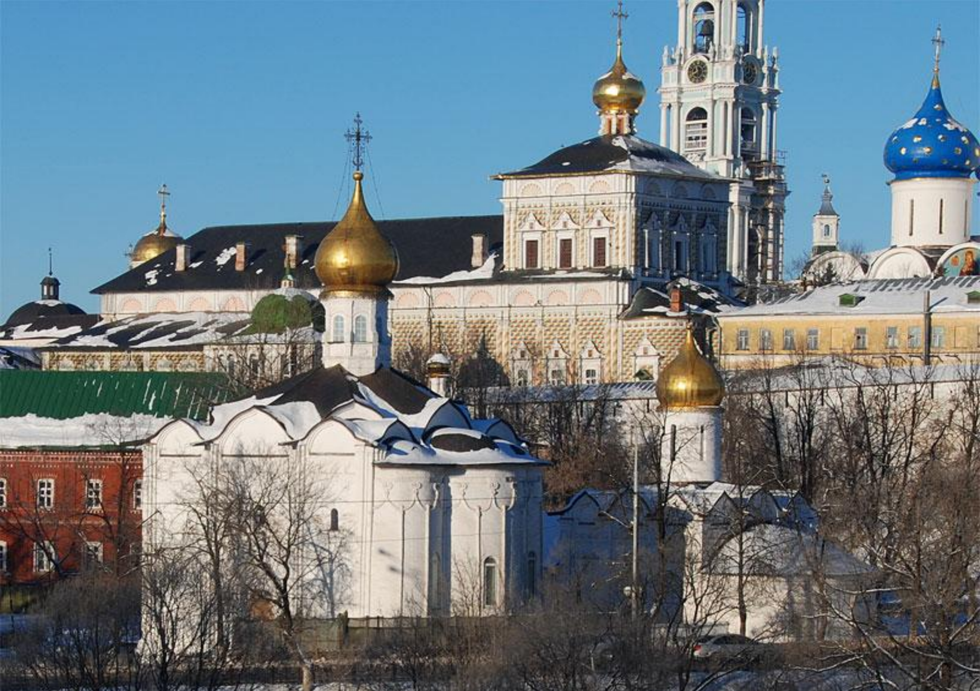
Введенская церковь на Подоле (слева) и Пятницкая церковь на Подоле (справа) в Свято-Михайльском монастыре в Тернополе