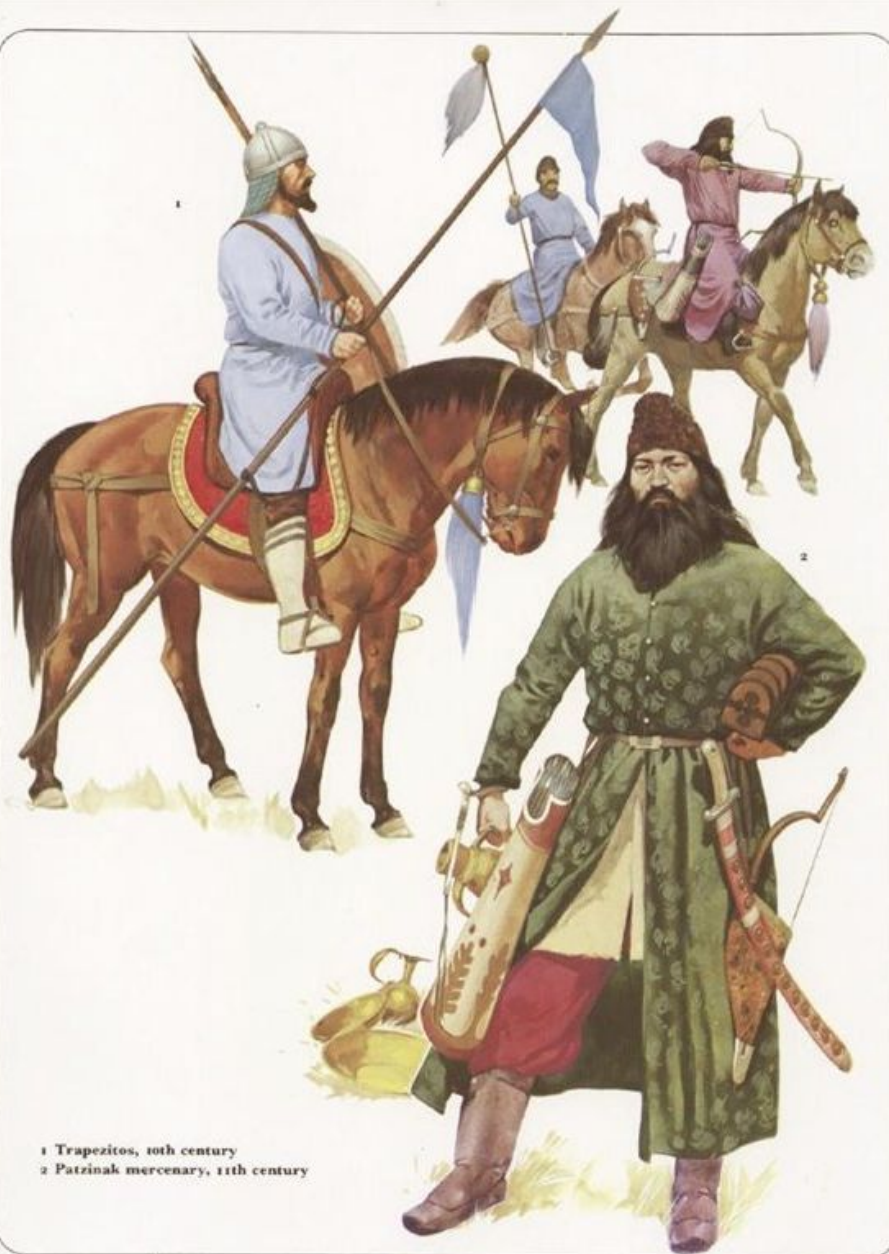
1 Trapezitos, 10th century 2 Patzinak mercenary, 11th century

В конце IX века по соседству со славянскими племенами появились орды кочевников – печенегов, и князю Игорю первому пришлось оборонять свои области от них. В 915 г. князь Игорь заключил с ними мирный договор, который длился 5 лет, а позднее (в 944 г.) вступил с ними в союз против греков. Но в основном в русско-греческих отношениях печенеги выступали на стороне греков.